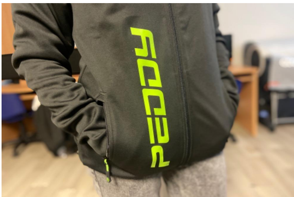
Obrázek 3: Návrh na potisk pro firmu Peddy

Firma Peddy nabízející prodej náradí a strojů je od školy vzdálená cca 500 m přímo na hlavní silnici. Z důvodu zájmu o služby potisku pro reklamní využití je sestavena kalkulace na potisk 16ks triček a 16ks mikin. Jelikož firma tento potisk na oděvech již má, je k dispozici grafický návrh již vytvořený z předchozí objednávky, kterou už má škola k dispozici. Návrh je ve velikosti 30 x 4 cm a obsahuje logo firmy. Pro výrobu potisku je potřeba zajištění speciální neonové fólie Sportsfilm ve žluté barvě. Práce na jednom kusu oděvu činí přibližně 15 minut, je tedy celková zakázka spočítána na 8 hodin.