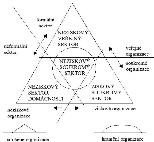
Obrázek 1: Členění národního hospodářství podle Pestoffa