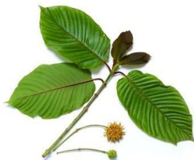
Obrázek 2: Listy a květenství rostliny Mitragyna speciosa . Převzato z [1].

Tropický strom Mitragyna speciosa je zástupcem malého rodu Mitragyna , který se řadí do čeledi mořenovitých rostlin ( Rubiaceae ). Jedná se o téměř výhradně stálezelený strom (opadavý pouze při delších obdobích sucha), který dosahuje výšky 15–20 metrů a šířky 5 metrů. Příčný kmen dosahuje tloušťky 60–100 cm a je na povrchu pokryt hladkou šedou kůrou, pod níž se nachází vrstva narůžovělého lýka. Sytě zelené listy s podkovovitou až srdcovitou čepelí jsou relativně velké – čepele eliptického tvaru dosahují délky 14–20 cm a šířky 7–12 cm. Střední žilka (cévní svazek) mladých listů mívá načervenalé zbarvení. Oboupohlavné květy jsou žluté, přisedlé a bývají uspořádány po trojicích v kulovitých hlávkách. Jednotlivé květy jsou oddělené listy a vytvářejí květenství o průměru 15–25 mm. Plodem M. speciosa je 7–9 mm dlouhá tobolka s vytrvalým kalichem narůžovělým kalichem, plody pak vytvářejí kulovitá plodenství o průměru 20–30 mm. Drobná semena (o délce asi 1 mm) mají papírovitá křídla na obou koncích.