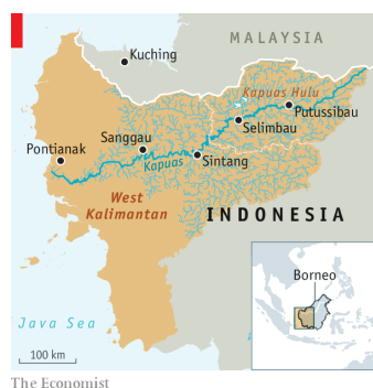
Obrázek 4: Mapa Indonésie s vyznačením regionu Kapuas Hulu. Převzato ze [111].

Pro Indonésii představuje kratom nejen rostlinu s dlouhou tradicí v lidovém léčitelství, ale především klíčovou exportní komoditu. Odhaduje se, že až 95 % surového kratomu importovaného do Spojených států v současné době pochází právě z Indonésie. [110] Hlavní oblastí pěstování kratomu v Indonésii je regentství Kapuas Hulu v provincii Západní Kalimantan.