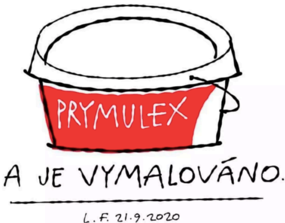
Obrázek č.2: Prymulex 76 (Lukáš Fibrich, 2020: Reflex).

(a) „ Prymulex //A je vymalováno [...], pro jistotu a pro historii je nutné zmínit se tu o jednom plukovníkovi, který dostal v září 2020 na hraní životy asi deseti miliónů lidí 75 [...],“ (Reflex, 2020).