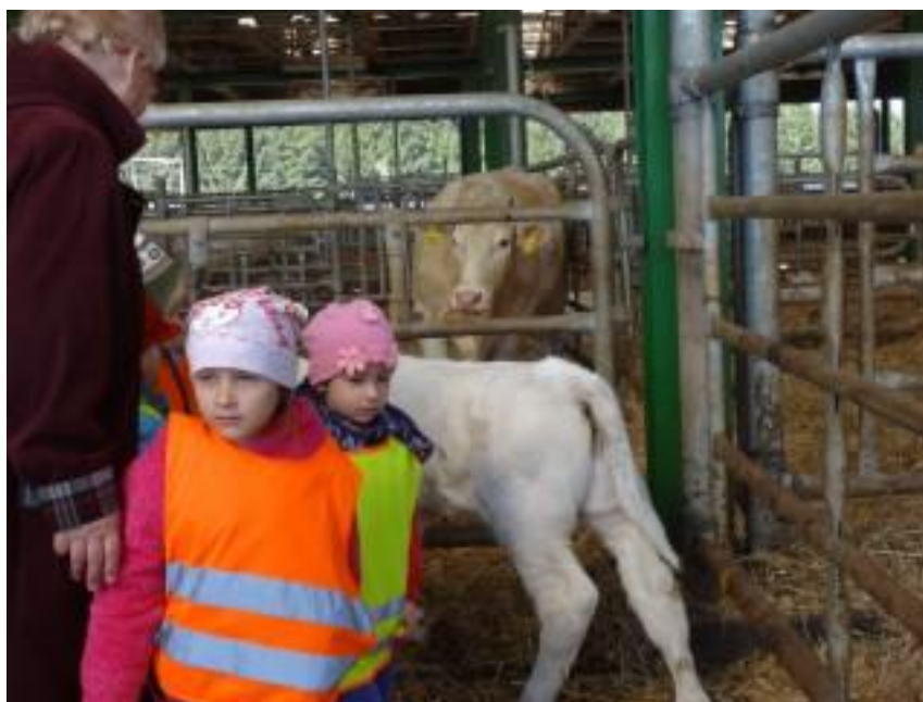
Obr. 18 – Návštěva místního statku