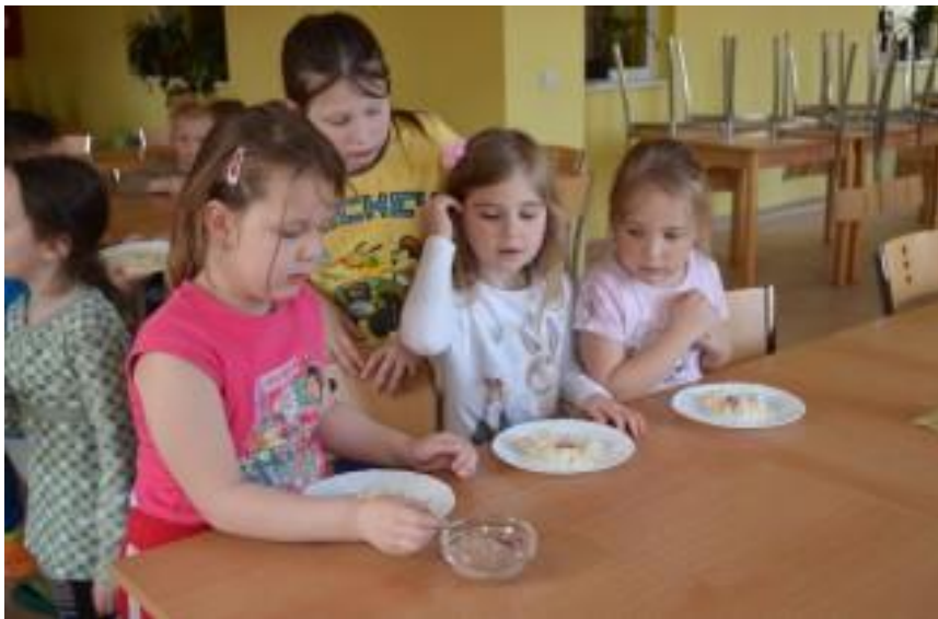
Obr. 4 – Zdobení ovesné kaše