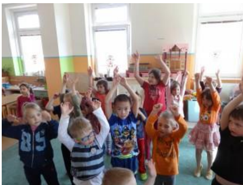
Obr. 8 – Žabička zelená