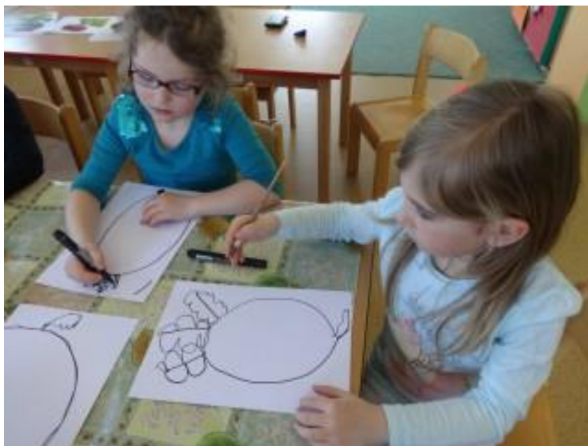
Obr. 9 – Malování řepy