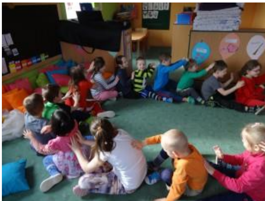
Obr. 13 – Řetězové masírování