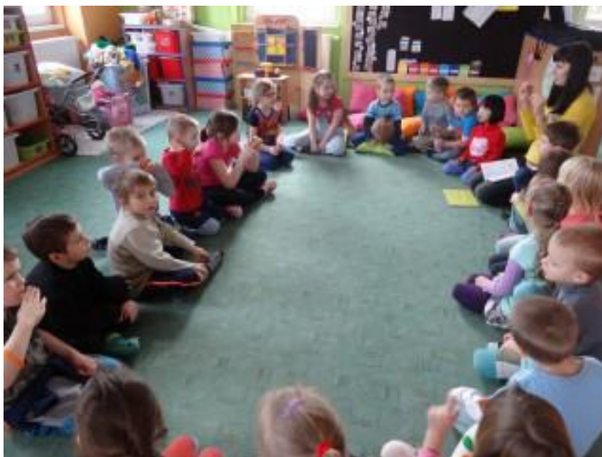
Obr. 2 – Kladení otázek a odpovědí