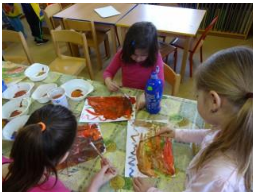
Obr. 6 – Držte pěsti, už se pěstí