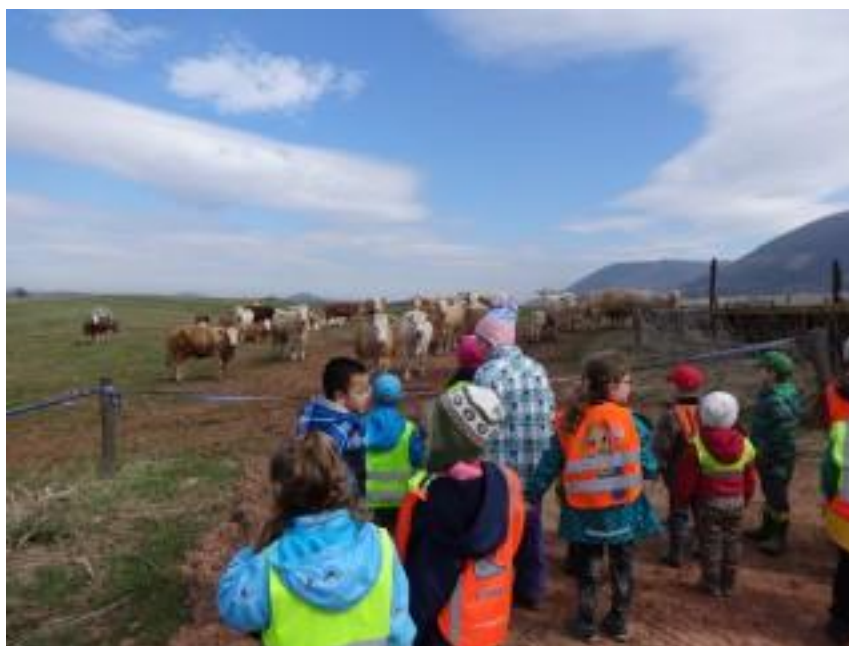
Obr. 20 – Návštěva místního statku