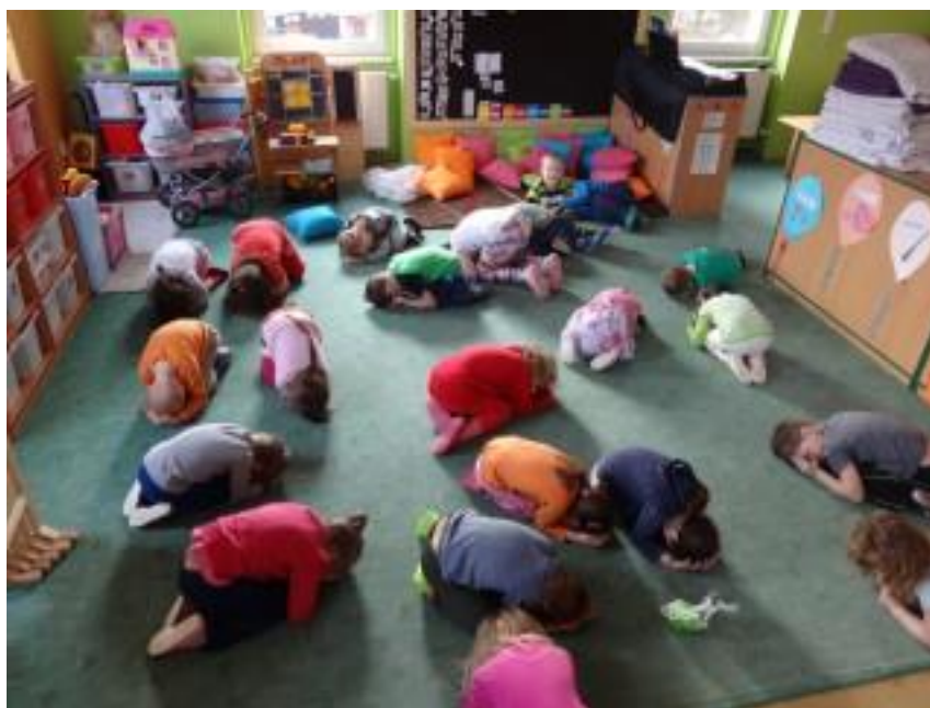
Obr. 1 – Pohybová chvílka Na kuřátka