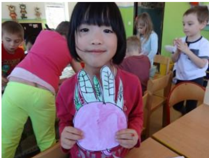
Obr. 11 – Řepa