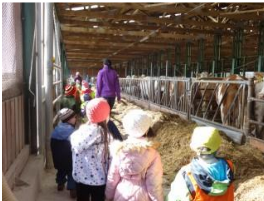
Obr. 17 – Návštěva místního statku