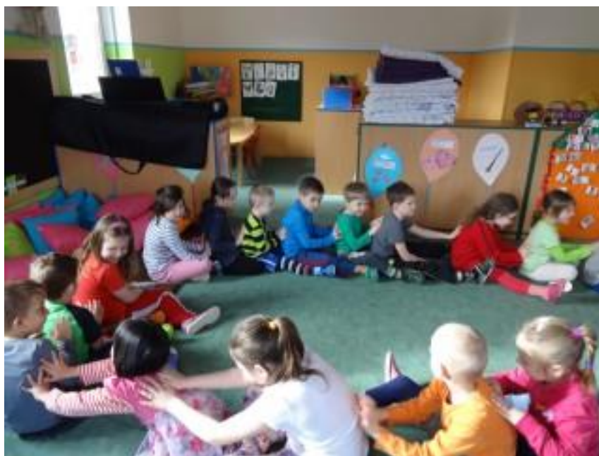
Obr. 14 – Řetězové masírování