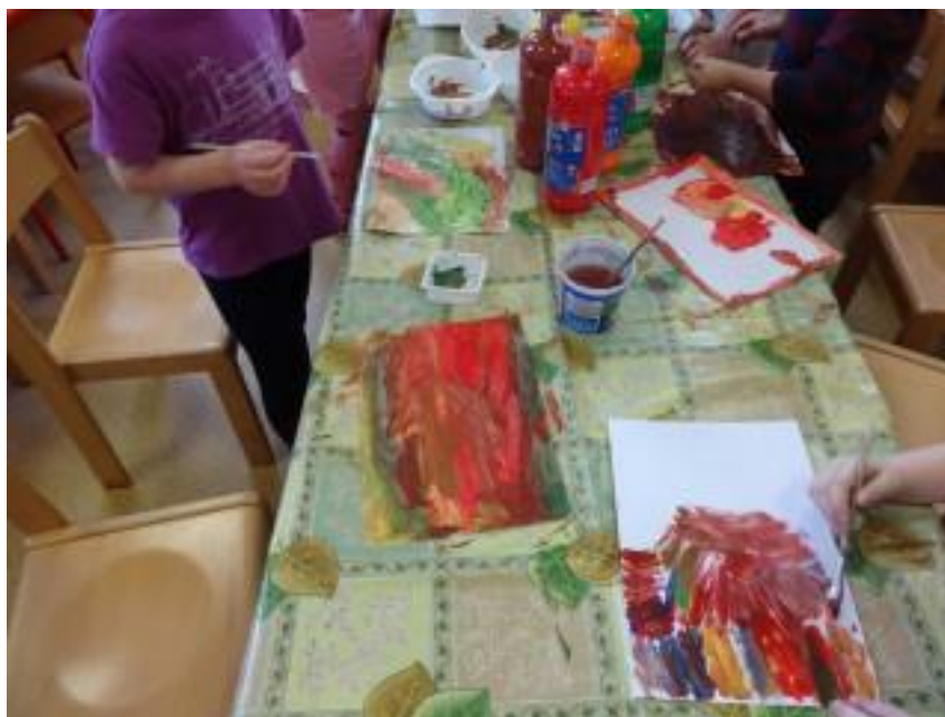
Obr. 5 – Držte pěsti, už se pěstí