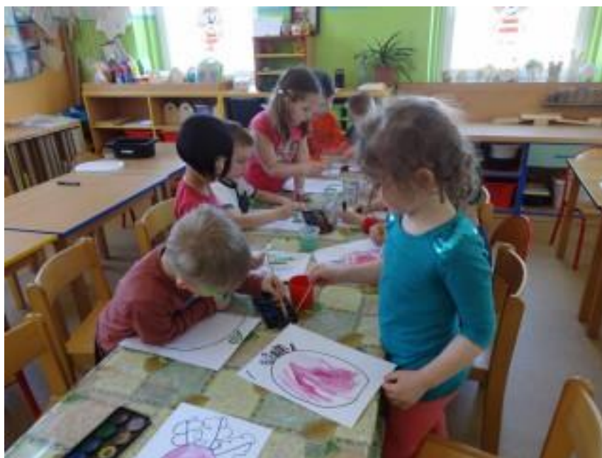
Obr. 10 – Malování řepy