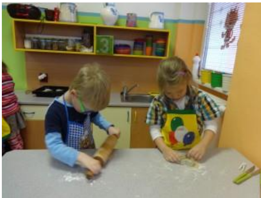
Obr. 15 – Pečení rohlíků