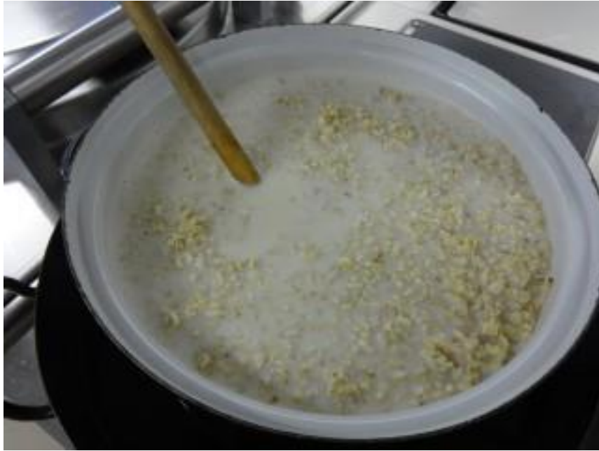
Obr. 3 – Vaření ovesné kaše