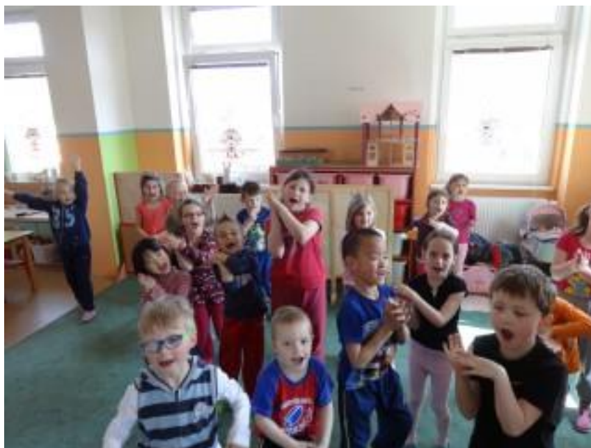
Obr. 7 – Žabička zelená