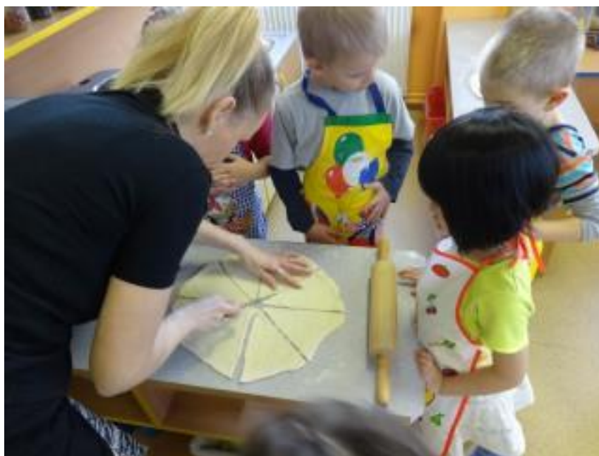
Obr. 16 – Pečení rohlíků