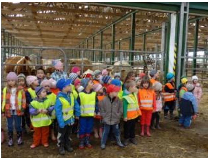
Obr. 19 – Návštěva místního statku