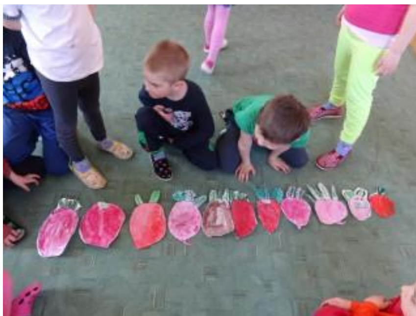
Obr. 12 – Přiřazování řep od největší po nejmenší