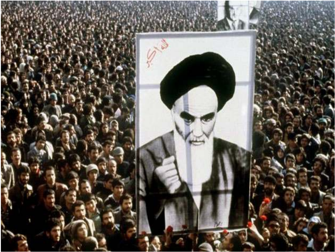
Protestanti pozvedávají plakát Ajatolláha Chomejního během demonstrace proti Šáhovi 1. ledna 1979.