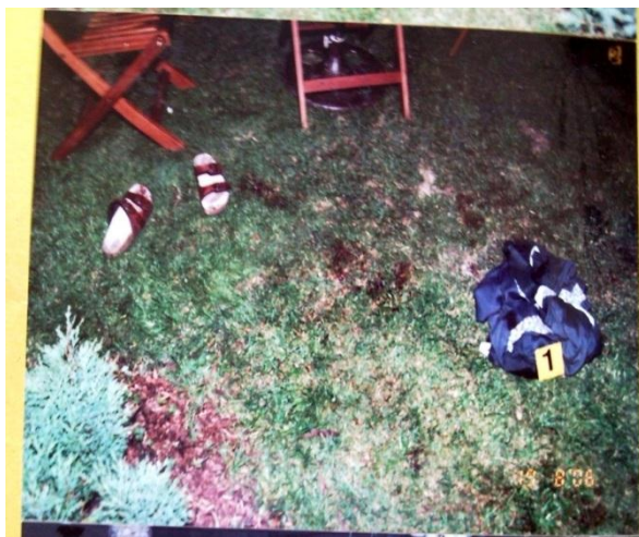
Obrázek 1: Místo činu

vzdálenosti, jednak celkového postavení obžalovaného od poškozeného v okamžiku střelby.“ 46 Uvedené oblečení bylo vyhozeno sousedem poškozeného na žádost jeho manželky.