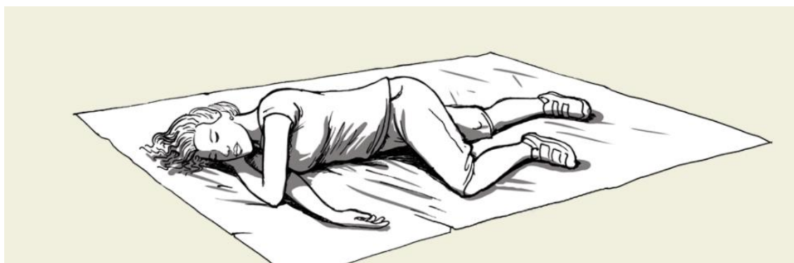
Obrázek 2: Zotavovací poloha (Mladý zdravotník, online, 2021-10-28a)