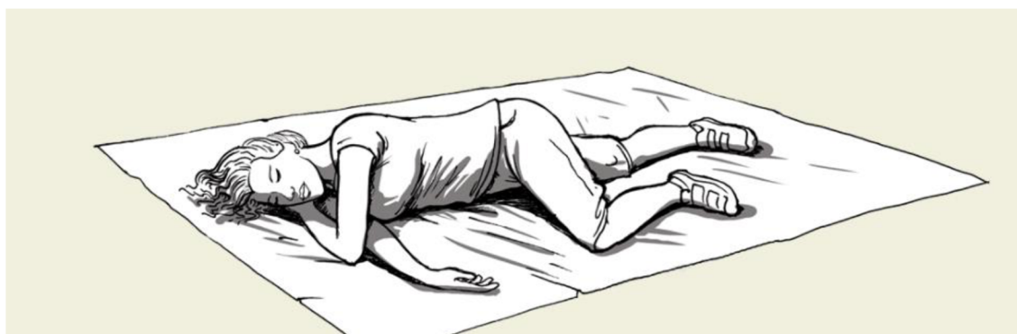
Obrázek 2: Zotavovací poloha (Mladý zdravotník, online, 2021-10-28a)