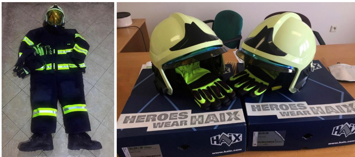
Obrázek 1: Kompletní oděv s přilbou a detail přilby s pracovními rukavicemi