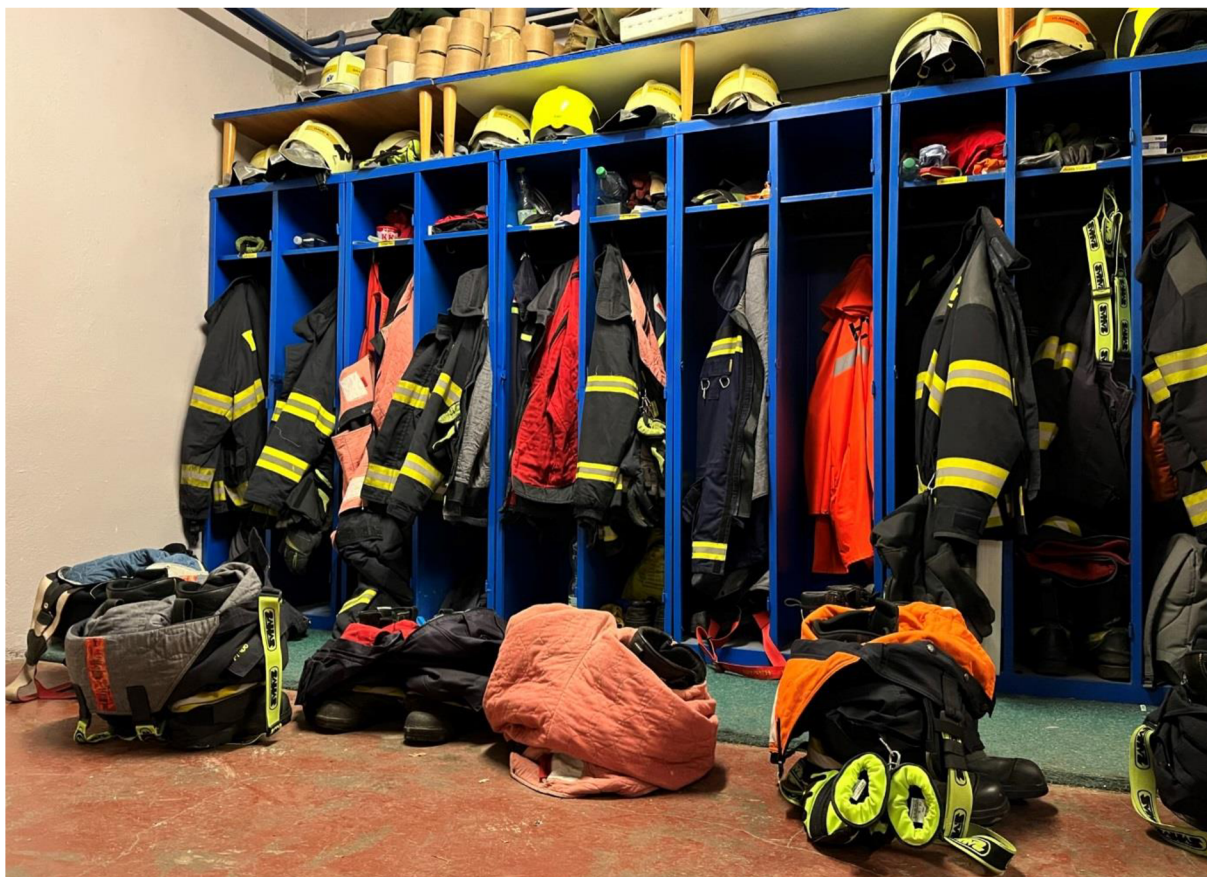
Obrázek 8: Zázemí požární zbrojnice s připravenými OOPP