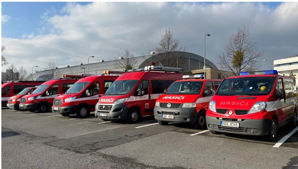
Obrázek 7: Využití DA pro dopravu členů SDH (spolku) na hasičské závody v Ostravě