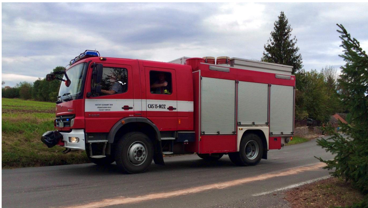
Obrázek 5: Příklad CAS na podvozku Mercedes-Benz ATEGO (2008)