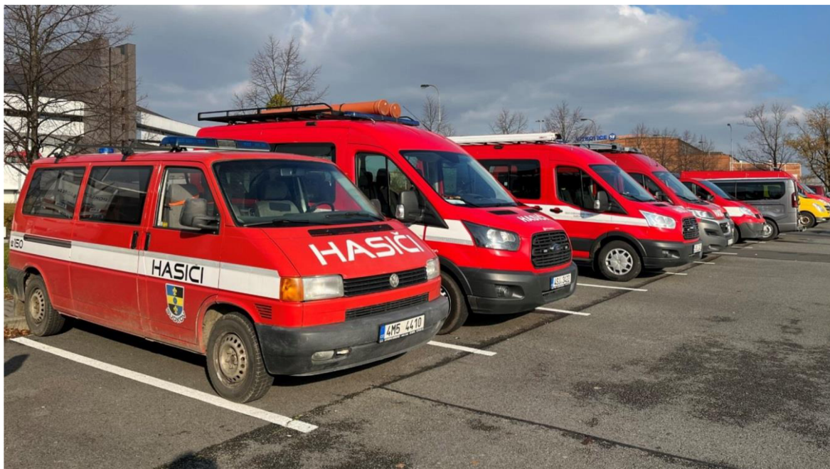
Obrázek 4: Příklady odlišných modelů DA různého stáří