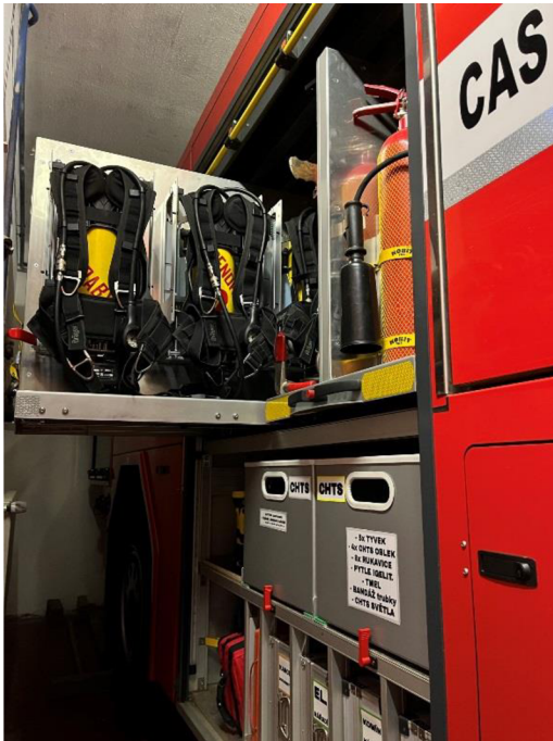
Obrázek 9: Příklad rozmístění příslušenství a materiálu v CAS