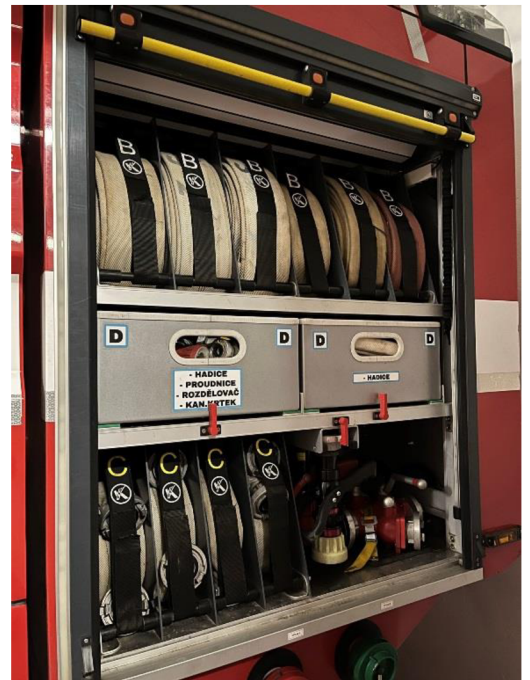
Prostor pro příslušenství na technické zásahy (vlevo). Prostor pro požární hadice, proudnice, rozdělovač apod. (vpravo).