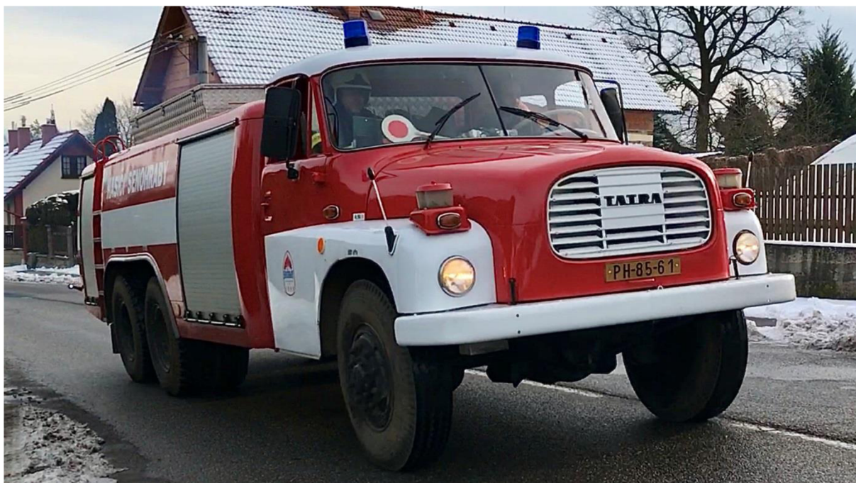
Obrázek 6: Příklad CAS na podvozku Tatra 148 (1976)