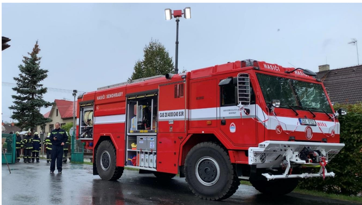
Obrázek 3: Příklad nové CAS na podvozku Tatra Force (2020)