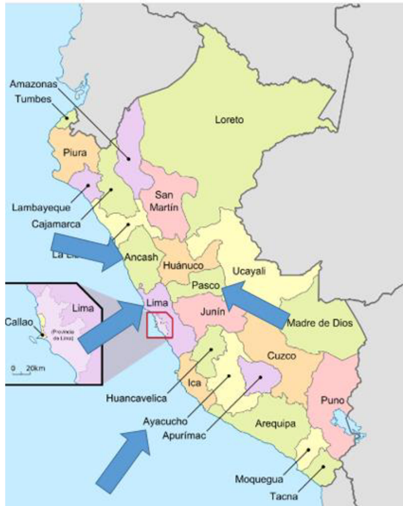
Obrázek 1 - Původ rodičů respondentů

minulého století jako následek chaosu, který nastal především v hlavním městě regionu Huaraz po zničujícím zemětřesení v roce 1970 13 (Rodríguez & Rojas, 2009, s. 103).