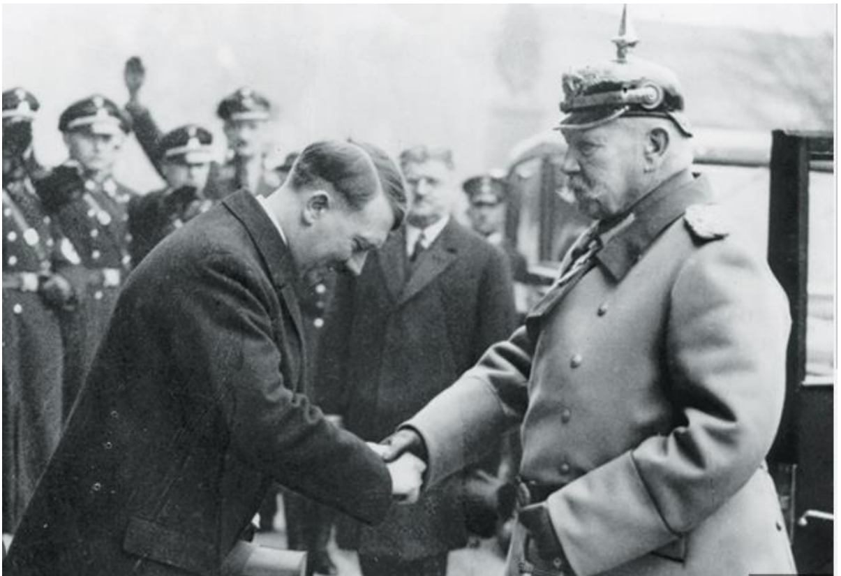
Příloha č. 7 - Adolf Hitler a Paul von Hindenburg 21. března 1933 v Postupimi

Zdroj: https://www.timeshighereducation.com/books/review-how-democracies-die-steven-levitsky-and-daniel-ziblatt-viking