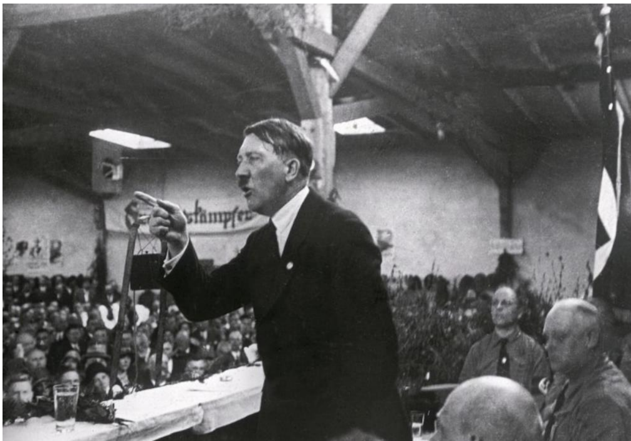
Příloha č. 5 – Hitler při projevu přibližně rok 1925