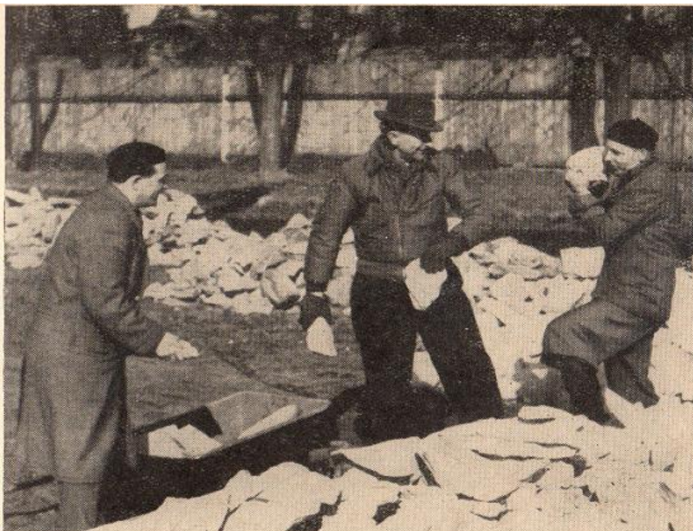
Zahájení prací na stavbě zimního stadiónu v Písku (Rakovan, dr. Lis, Chudomelka)

Obr. 1: Prvopočátky výstavby zimního stadionu v Písku