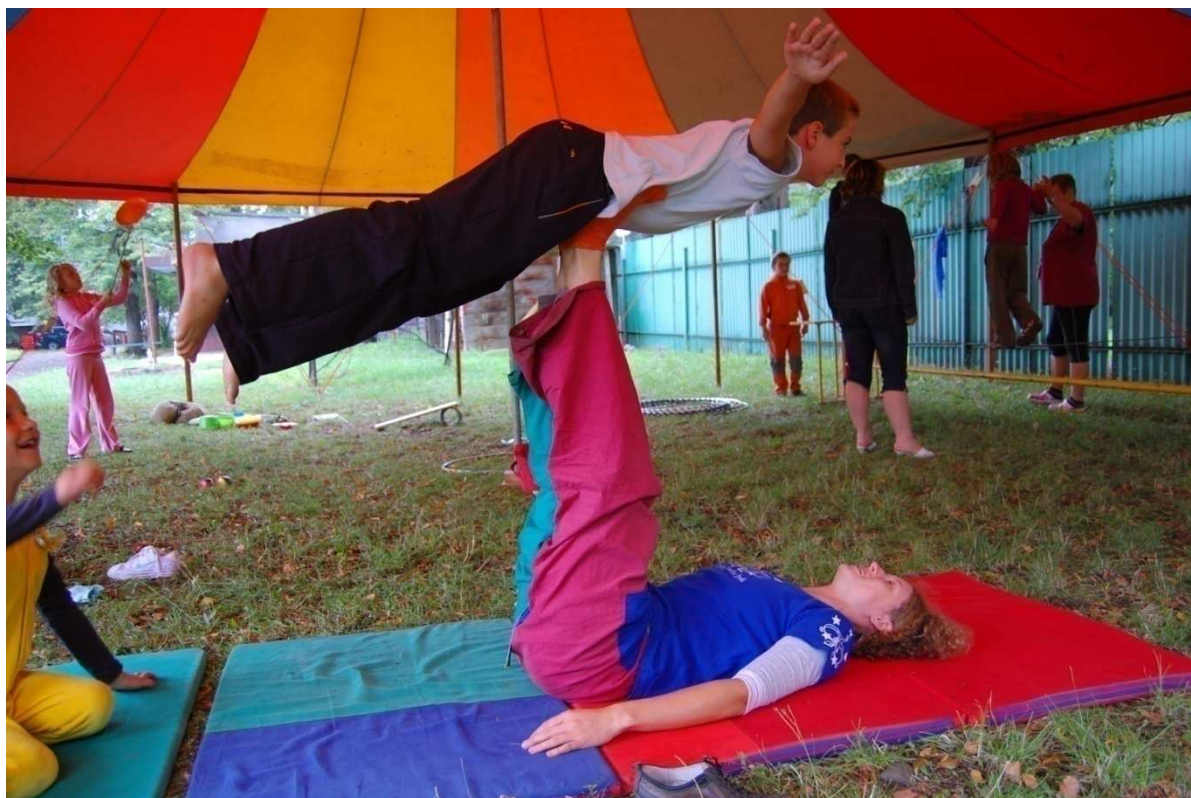
© Fotografie Markéta Kravčenková, cirkusová školka Frýdek – Místek