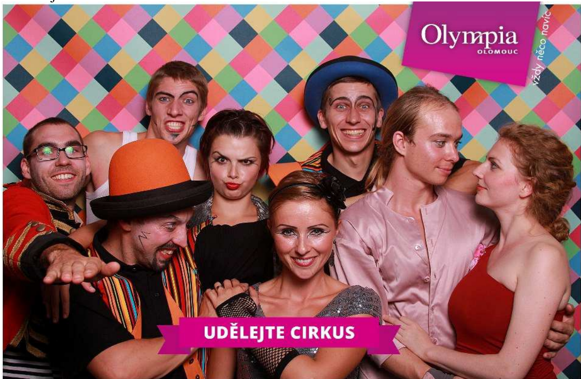
© Cirkus trochu jinak, propagační fotografie obchodního centra Olympia Olomouc