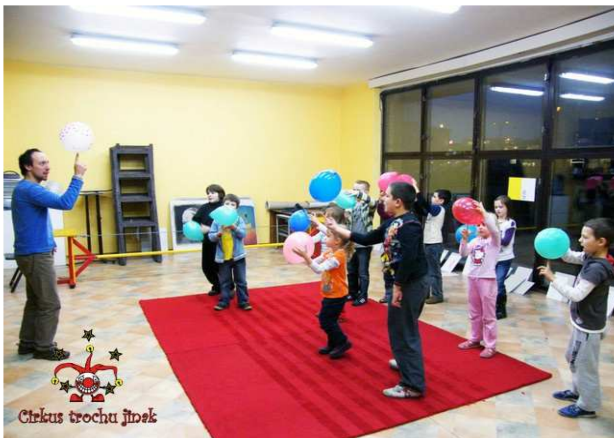
© Cirkus troch jinak, fotografie z cirkusové školy.