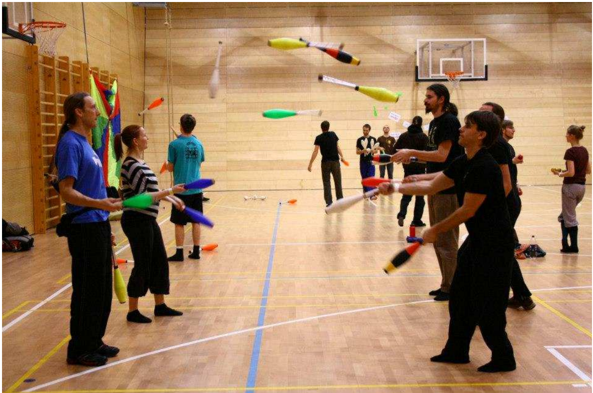
© Divadlo KUFR, International Brno jugglingconvention