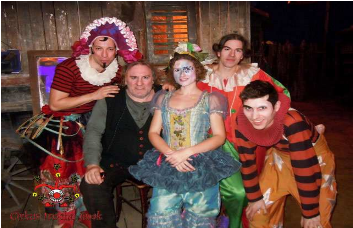
© Cirkus trochu jinak, fotografie z barrandovského natáčení filmu Muž, který se směje