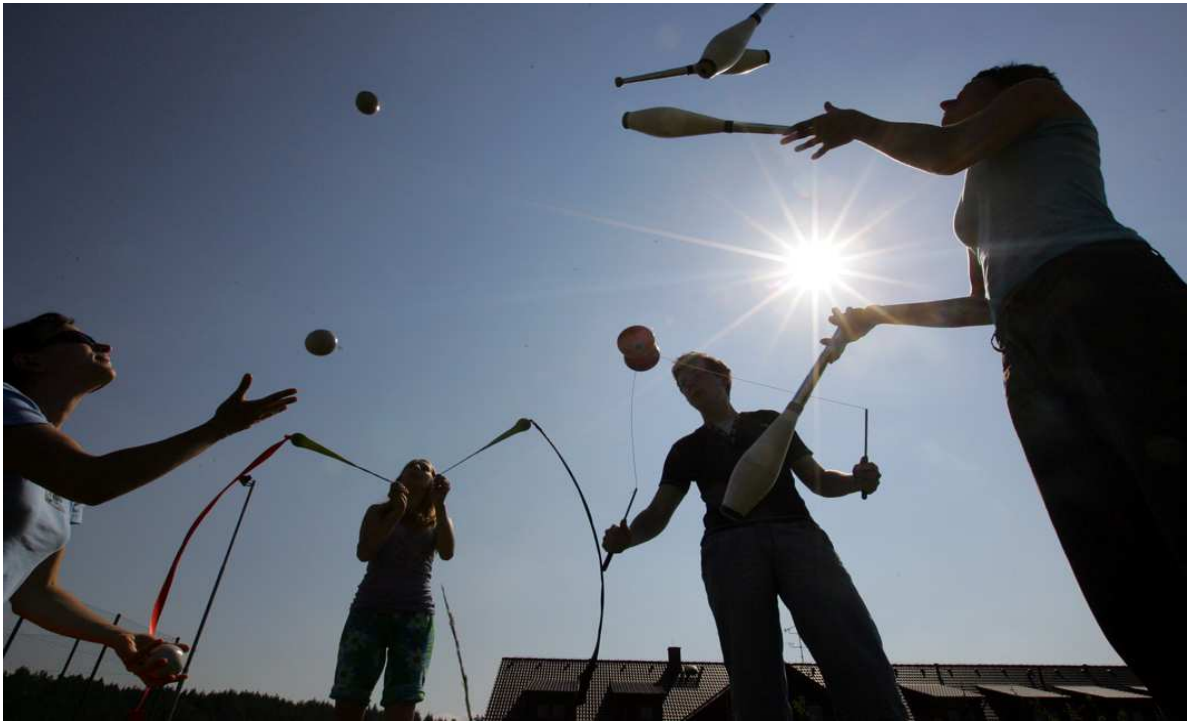
© Divadlo KUFR, žonglérská dílna Aleje