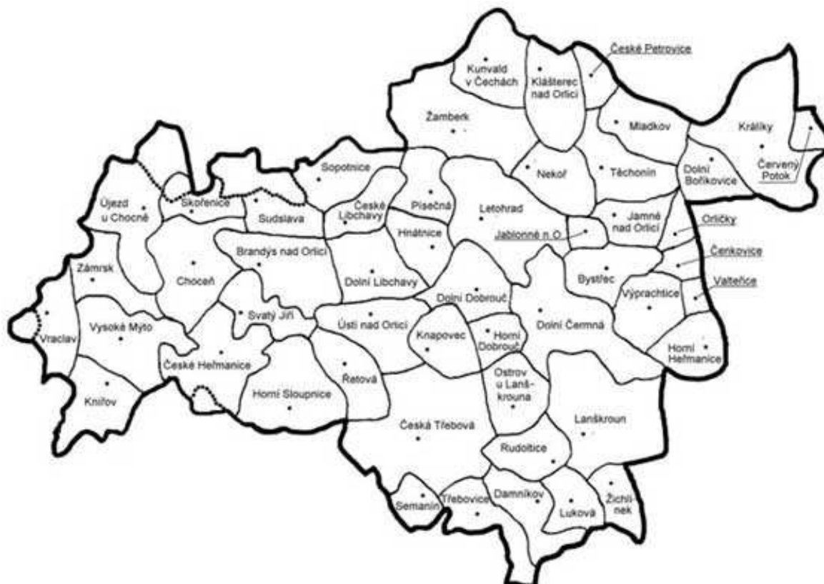
Mapa vikariátu ústeckoorlického 40

Vikariát Ústí nad Orlicí je vzhledem k počtu obyvatel a farností jedním z největších v diecézi Hradec Králové. Celkem zahrnuje 38 farností, které jsou pravidelně vizitovány okrskovým vikářem. Ten v rámci těchto vizitací navštěvuje i výuku náboženství ve školách a katecheze ve farnostech.