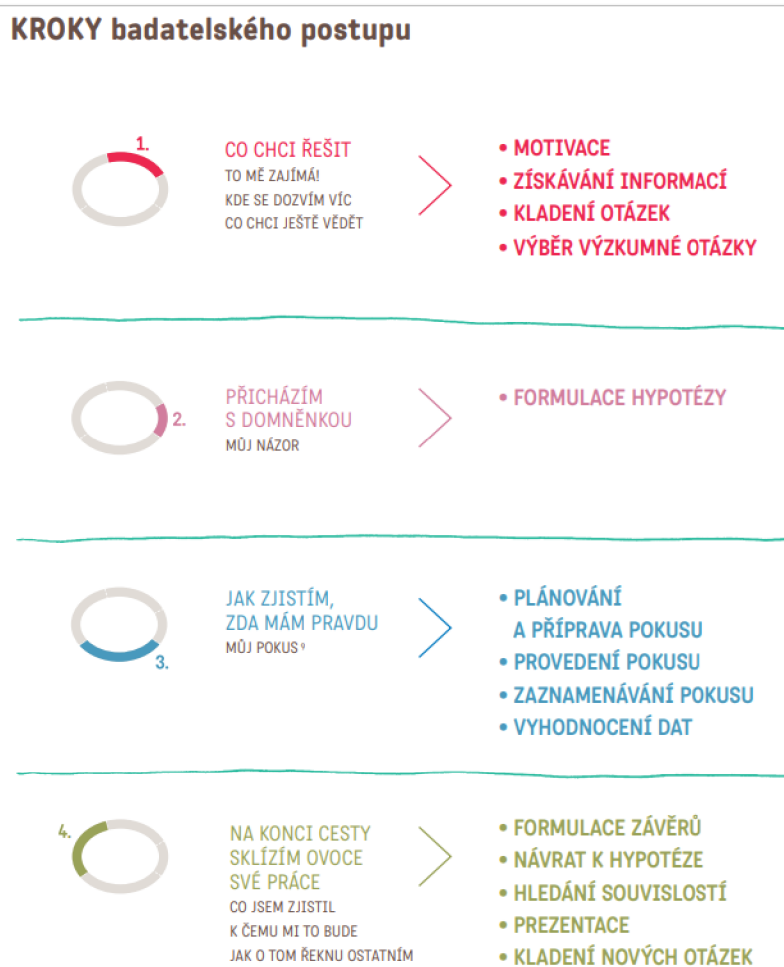
Obrázek 3: Kroky badatelského postupu

Obecně lze konstatovat, že se autoři na jednotlivých fázích neshodují, dle Krupové & Rochovské (2018), závisí na tom, jakou diskusi cestou se při bádání děti s pedagogy vydají, a také je nutné považit proces konkrétní badatelské činnosti.