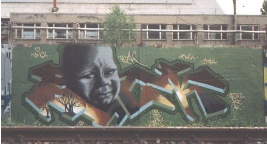
2. Obr. Buck, sprej na zdi, sklárny Vsetín 1997