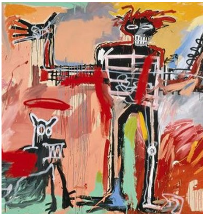
4. Obr. Kombinovaná technika na plátně

Díky účasti na Documentě 7 v Kasselu a na newyorském Whitney Bienále v roce 1983 se stává mediální hvězdou. 28