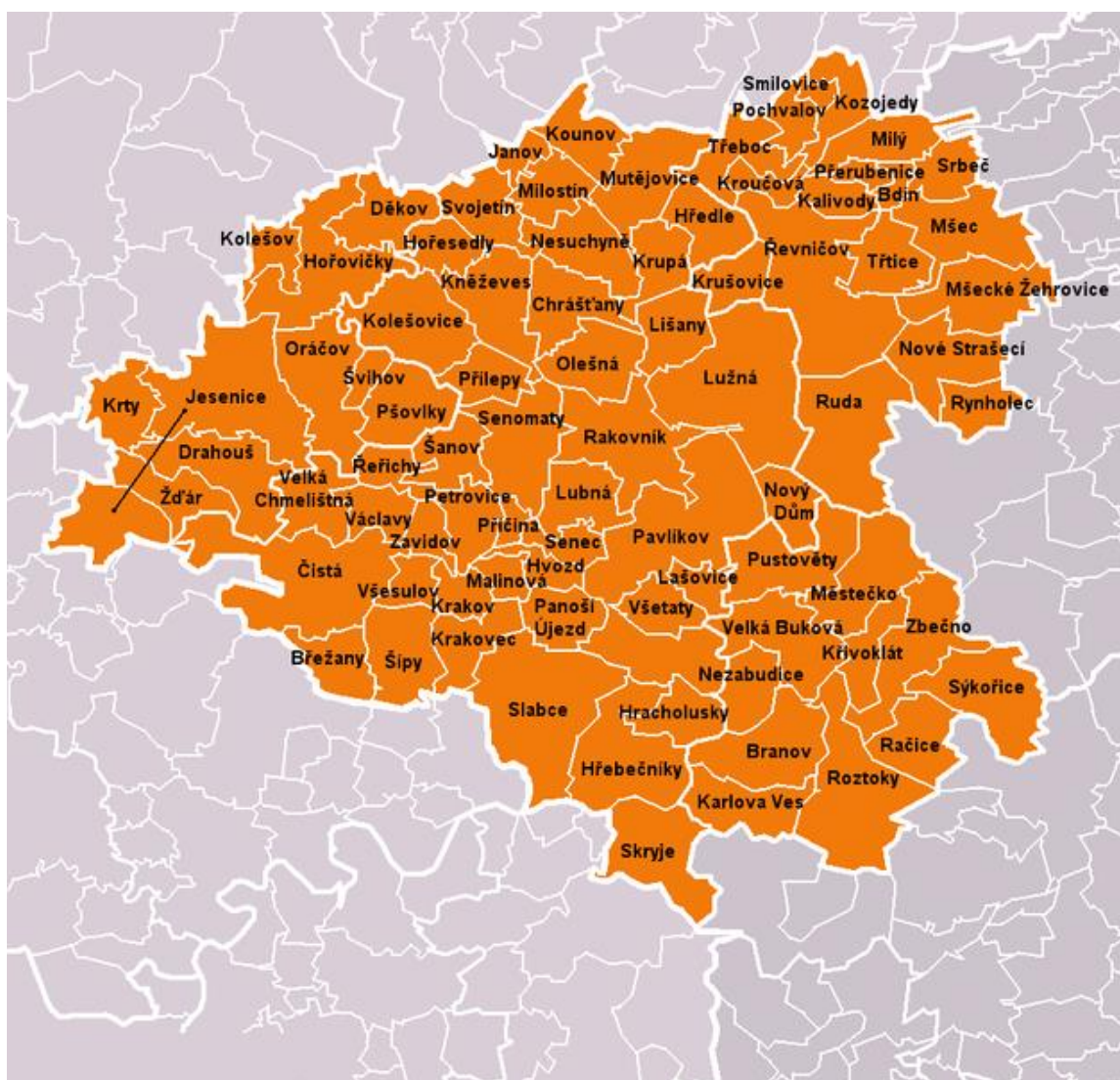
Obr. č. 2: Rozsah okresu Rakovník s vyznačenými názvy a hranicemi obcí