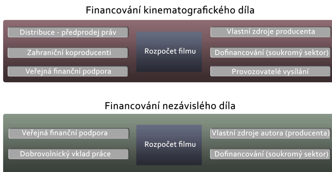
Obrázek č. 2: Rozdíly ve financování kinematografického (myšleno distribučního) a nezávislého díla