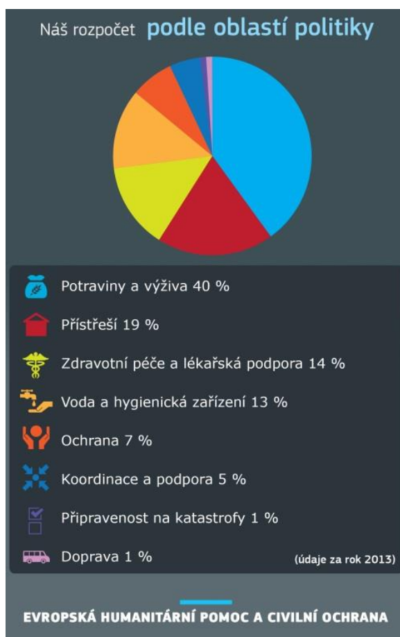
Obrázek č. 3 Rozložení finančních prostředků EU za rok 2013 do oblastí humanitární pomoci

Nástroje k poskytování humanitární pomoci byly tvořeny již se vznikem Evropského hospodářského společenství. Z celosvětového hlediska jsou orgány Evropské unie, včetně států unie, největšími dárci humanitární pomoci na světě a jejich opatření koordinuje Úřad pro humanitární pomoc a civilní ochranu (ECHO), které spolupracuje s partnery na místě, zejména s OSN a nevládními organizacemi. ECHO disponuje prostředky Evropské unie na humanitární pomoc, které se podle samotné Evropské unie dostanou k více než 120 milionům lidí ročně (EU, 2016).