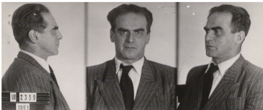
Generální tajemník ÚV KSČ, Rudolf Slánský.