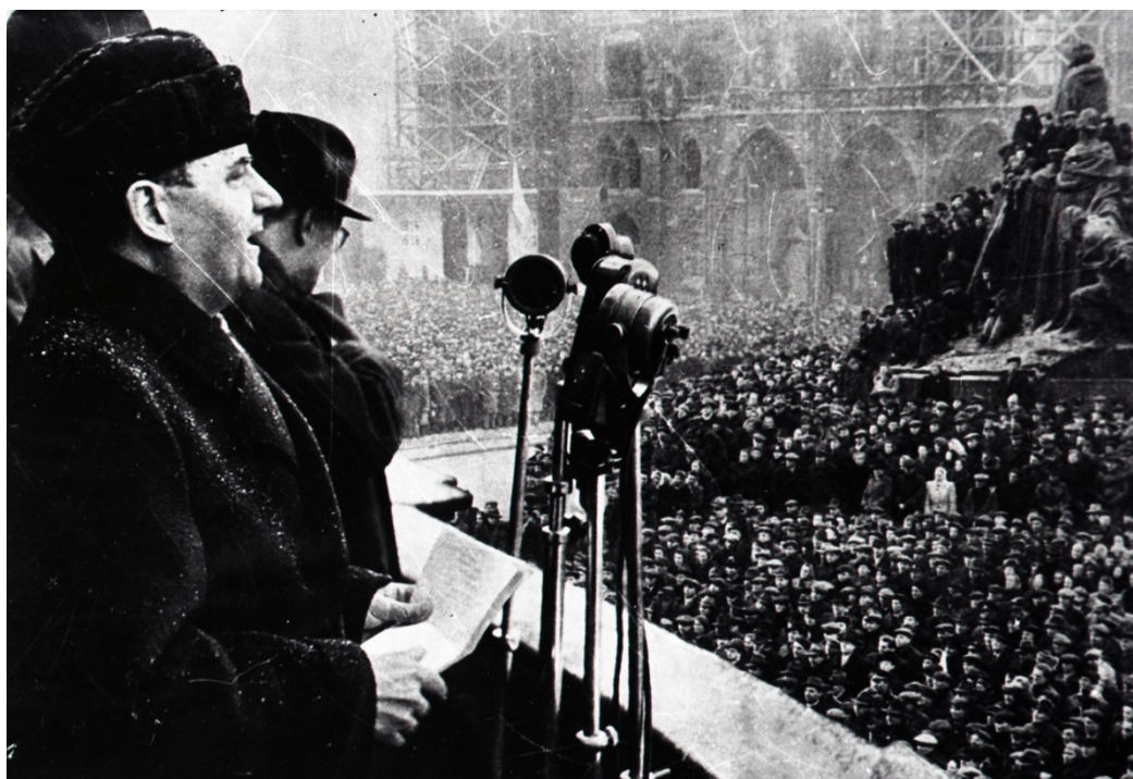
Projev Klementa Gottwalda na Staroměstském náměstí 25. února 1945.