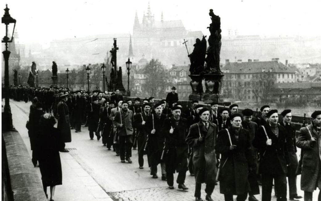
Milicionáři pochodující přes Karlův most dne 25. února 1948.