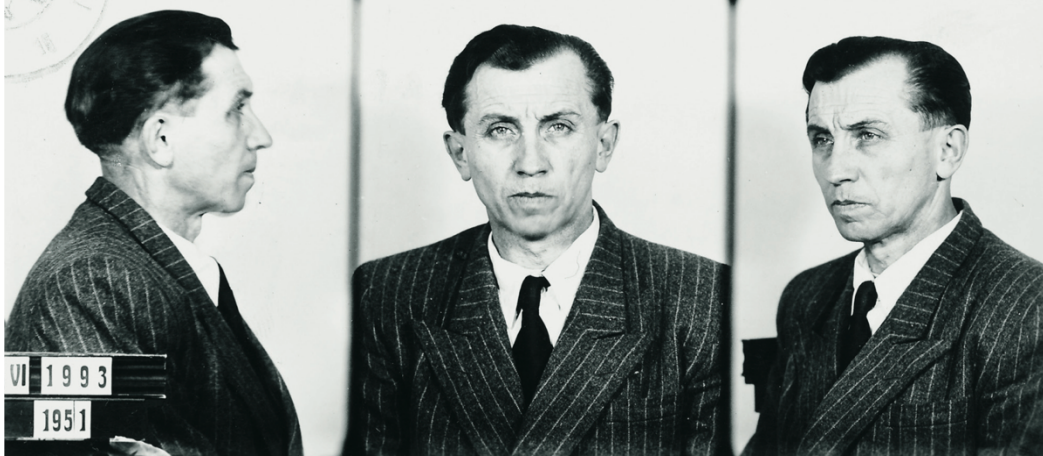
Náčelník hlavního štábu Lidových milicí v Praze, Josef Pavel.

„režim, neochvějně podporovaný ozbrojenými složkami včetně Lidových milicí, pokračoval v brutálním potlačování jakýchkoliv náznaků nesouhlasů s totalitní komunistickou mocí.“ 259