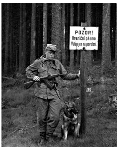
Zakázané pásmo Pavlův Studenec.