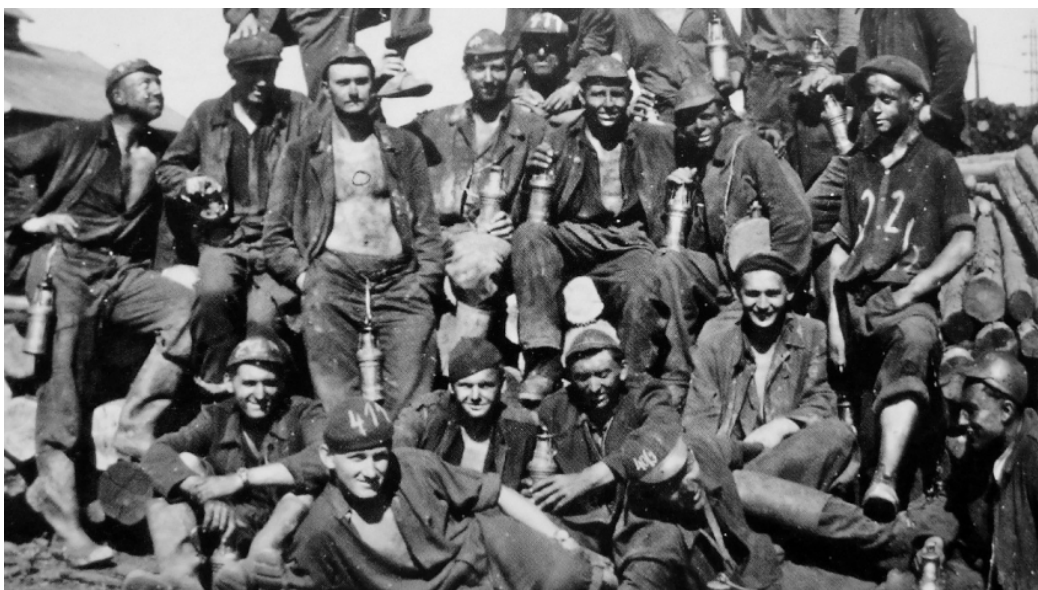
Příslušníci Pomocných technických praporů na Ostravsku.

Oficiálním dnem vzniku PTP se stalo 1. září 1950 související s nástupem Alexeje Čepičky do funkce ministra národní obrany a s návrhem Obráného zpravodajství vedeného Bedřichem Reicinem. 300