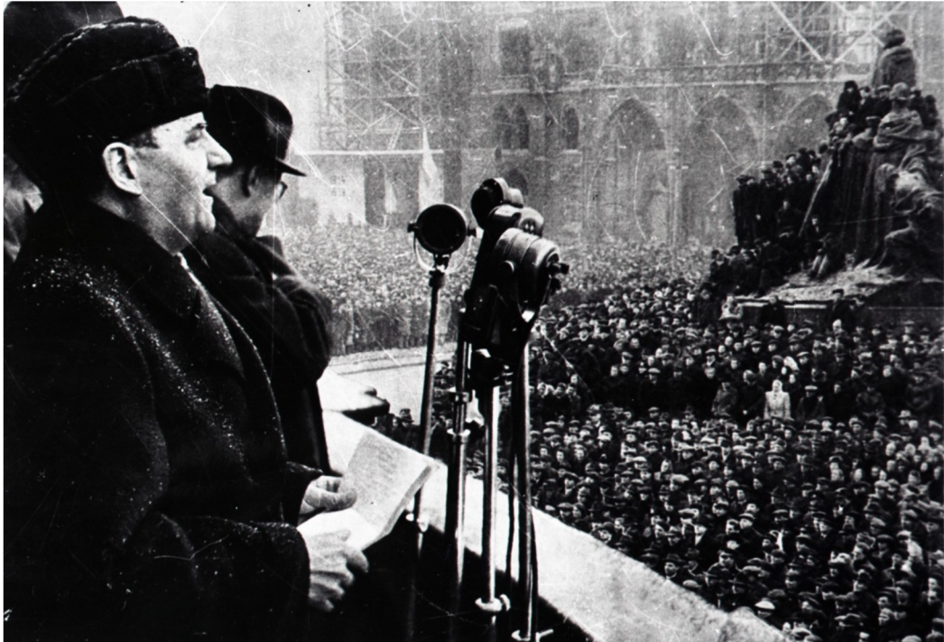
Projev Klementa Gottwalda na Staroměstském náměstí 25. února 1945.