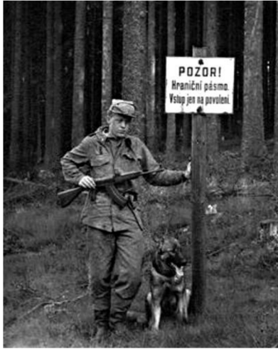
Zakázané pásmo Pavlův Studenec.