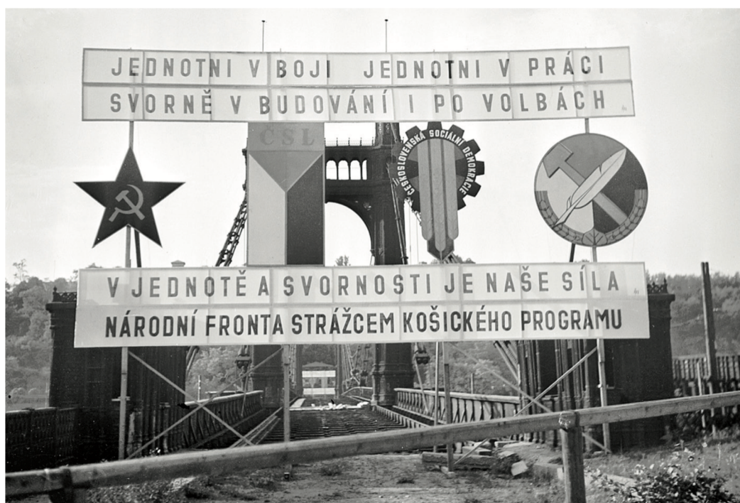
Volební poutač politických stran Národní fronty. Zleva KSČ, ČSL, ČSSD, ČSNS.

objektu či politické strany. Důraz byl kladen na poznávání opozičních sil s možností využití jakéhokoli potenciálu ve prospěch KSČ. 57