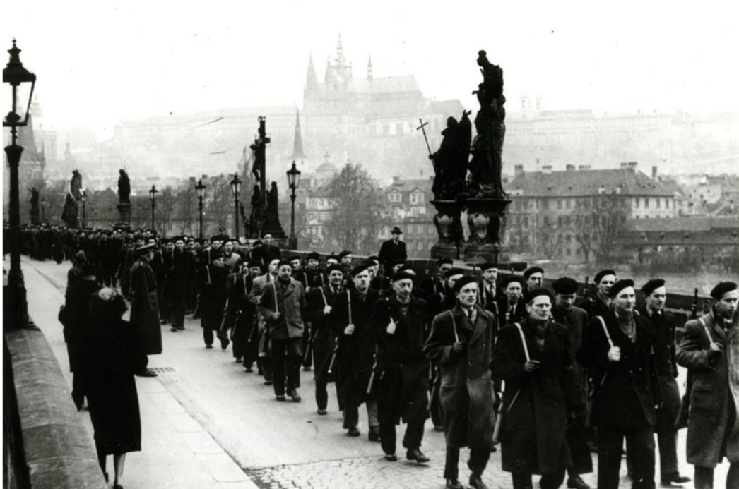
Milicionáři pochodující přes Karlův most dne 25. února 1948.