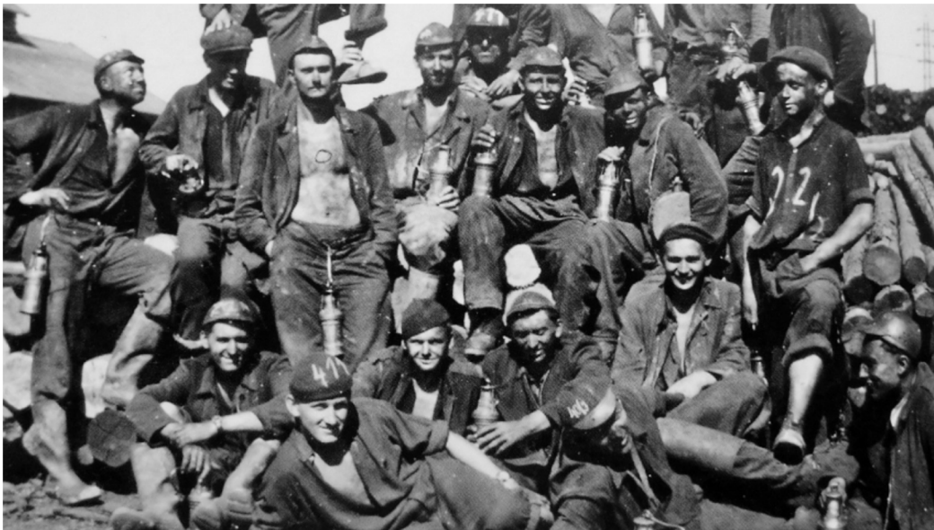
Příslušníci Pomocných technických praporů na Ostravsku.

Oficiálním dnem vzniku PTP se stalo 1. září 1950 související s nástupem Alexeje Čepičky do funkce ministra národní obrany a s návrhem Obranného zpravodajství vedeného Bedřichem Reicinem. 300