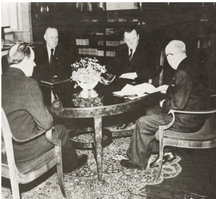
Audience u prezidenta před podpisem nové vlády 25. února 1948. Zleva Antonín Zápotocký, Václav Nosek, Klement Gottwald a Edvard Beneš.