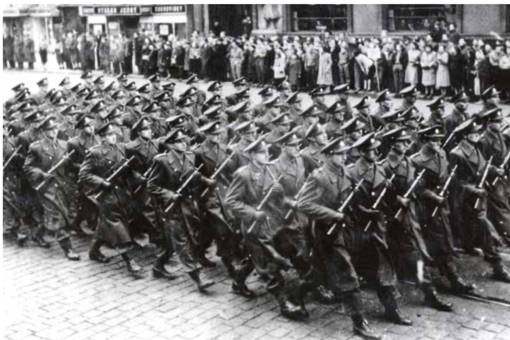
Příslušníci SNB pochodující Prahou dne 25. února 1948.