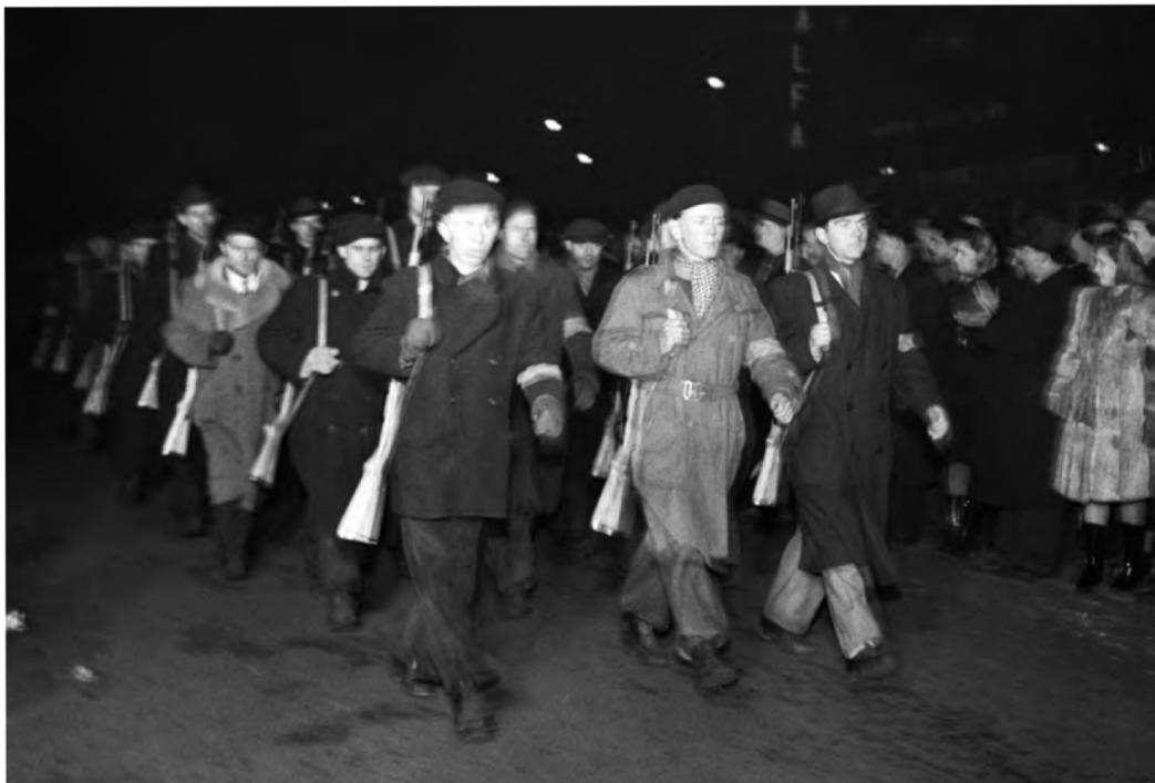
Demonstrační pochod ozbrojených milicionářů centrem Prahy ve večerních hodinách 25. února 1948.