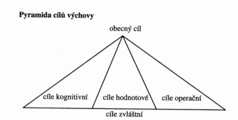
Obr. č. 2. Pyramida cílů výchovy

V rodině by měla probíhat výchova v souladu s obecnými cíli výchovy. Obecně se cílem výchovy rozumí jakýsi ideál nebo představa toho, čeho bychom měli ve výchově dosáhnout. Níže uvádím obrázek cílů dle Pařízka, které uvádí Grecmanová (2002, s. 99.).