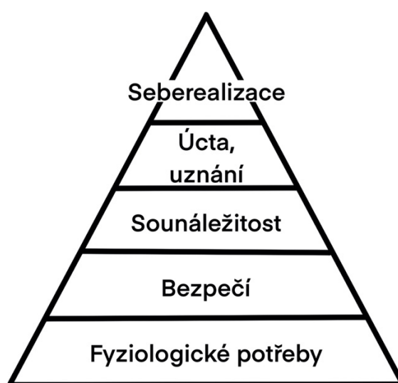
Obrázek 2: Maslowova hierarchie potřeb