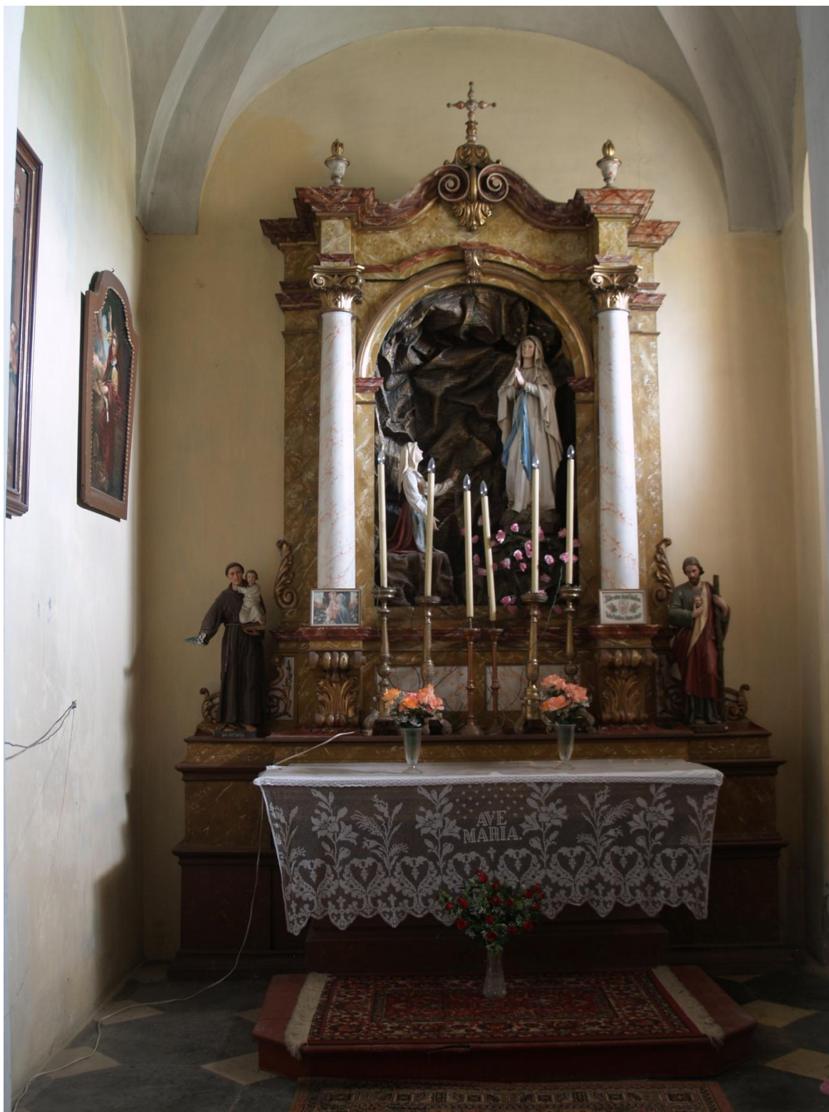
6) Kostel Očištvání Panny Marie v Dubu nad Moravou, kaple Panny Marie Lurdské