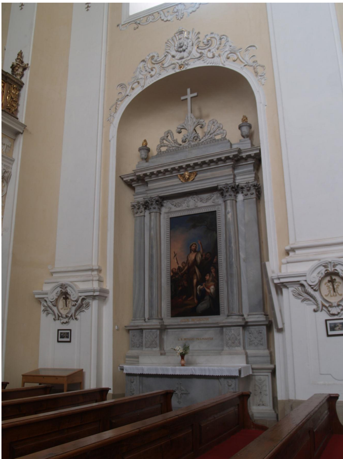
17) Kostel Očištvání Panny Marie v Dubu nad Moravou, evangelní strana - Neoklasicistní boční oltář sv. Jana Křtitele