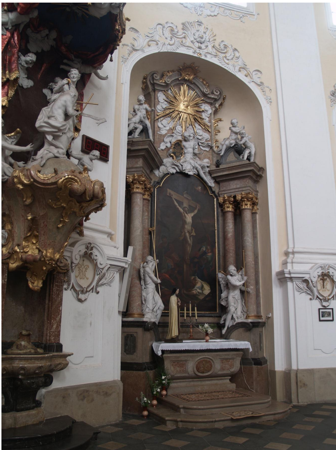
10) Kostel Očištvání Panny Marie v Dubu nad Moravou, epištolní strana - boční oltář sv. Kříže z roku 1756, foto P. Antonín Basler