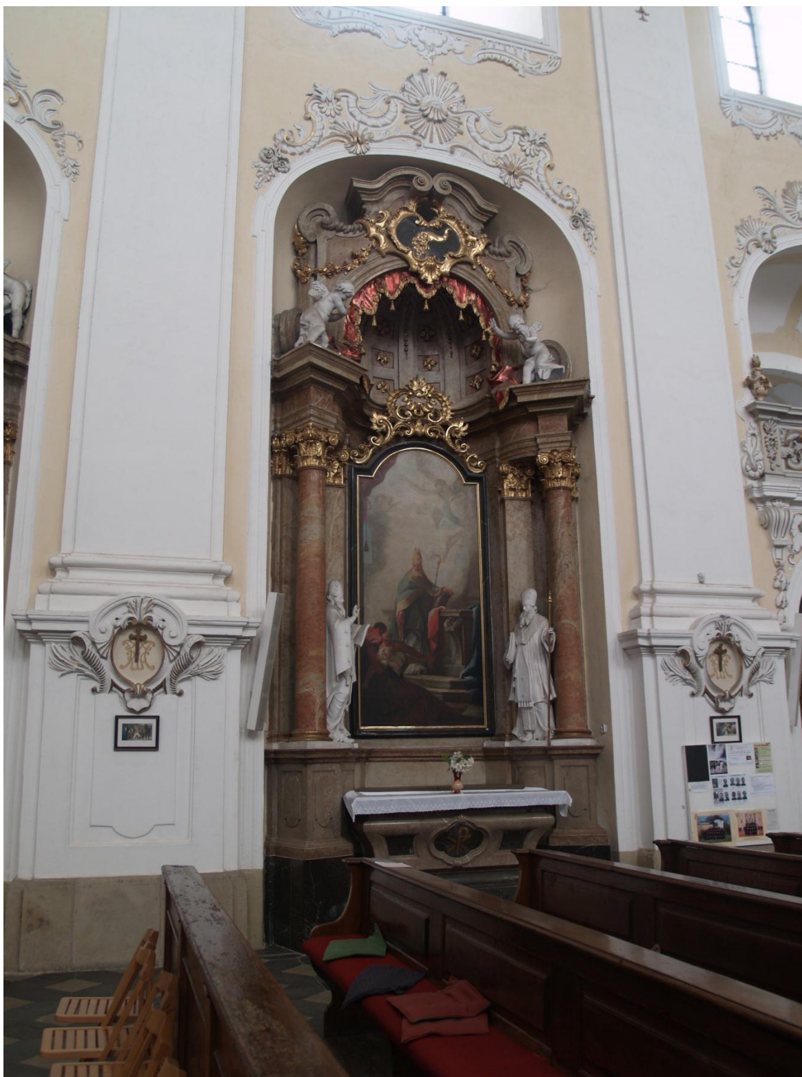
11) Kostel Očišťování Panny Marie v Dubu nad Moravou, epištolní strana - boční oltář sv. Valentina