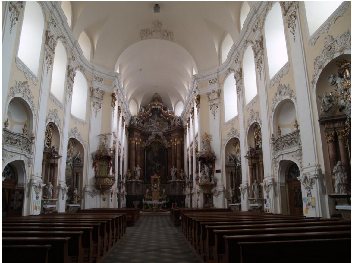
3) Kostel Očištvání Panny Marie v Dubu nad Moravou, pohled do interiéru kostela k presbytáři s hlavním oltářem, foto P. Antonín Basler