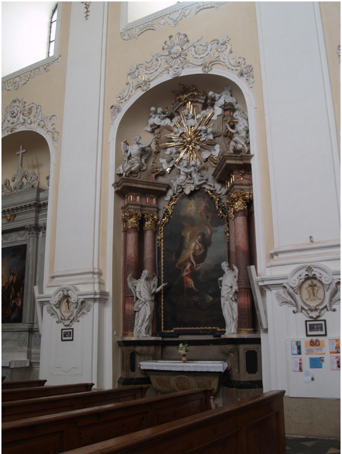
15) Kostel Očištvání Panny Marie v Dubu nad Moravou, evangelní strana – boční oltář Anděla Strážce