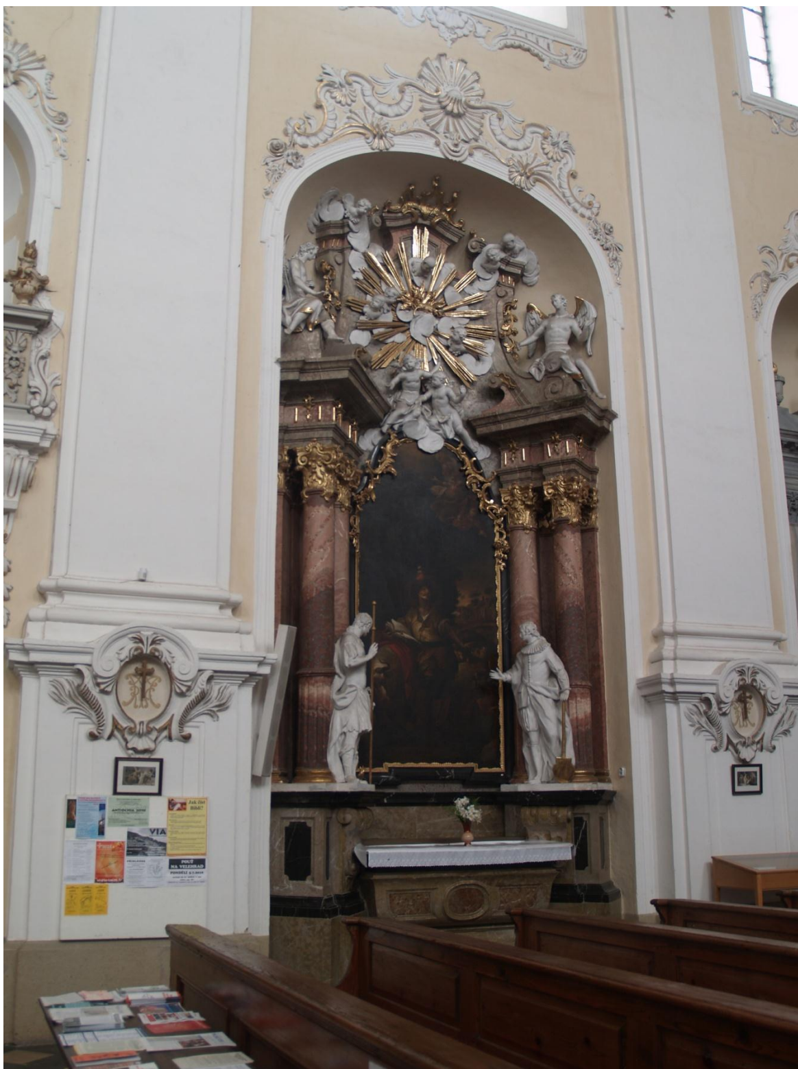
12) Kostel Očišťování Panny Marie v Dubu nad Moravou, epištolní strana – boční oltář sv. Vendelína