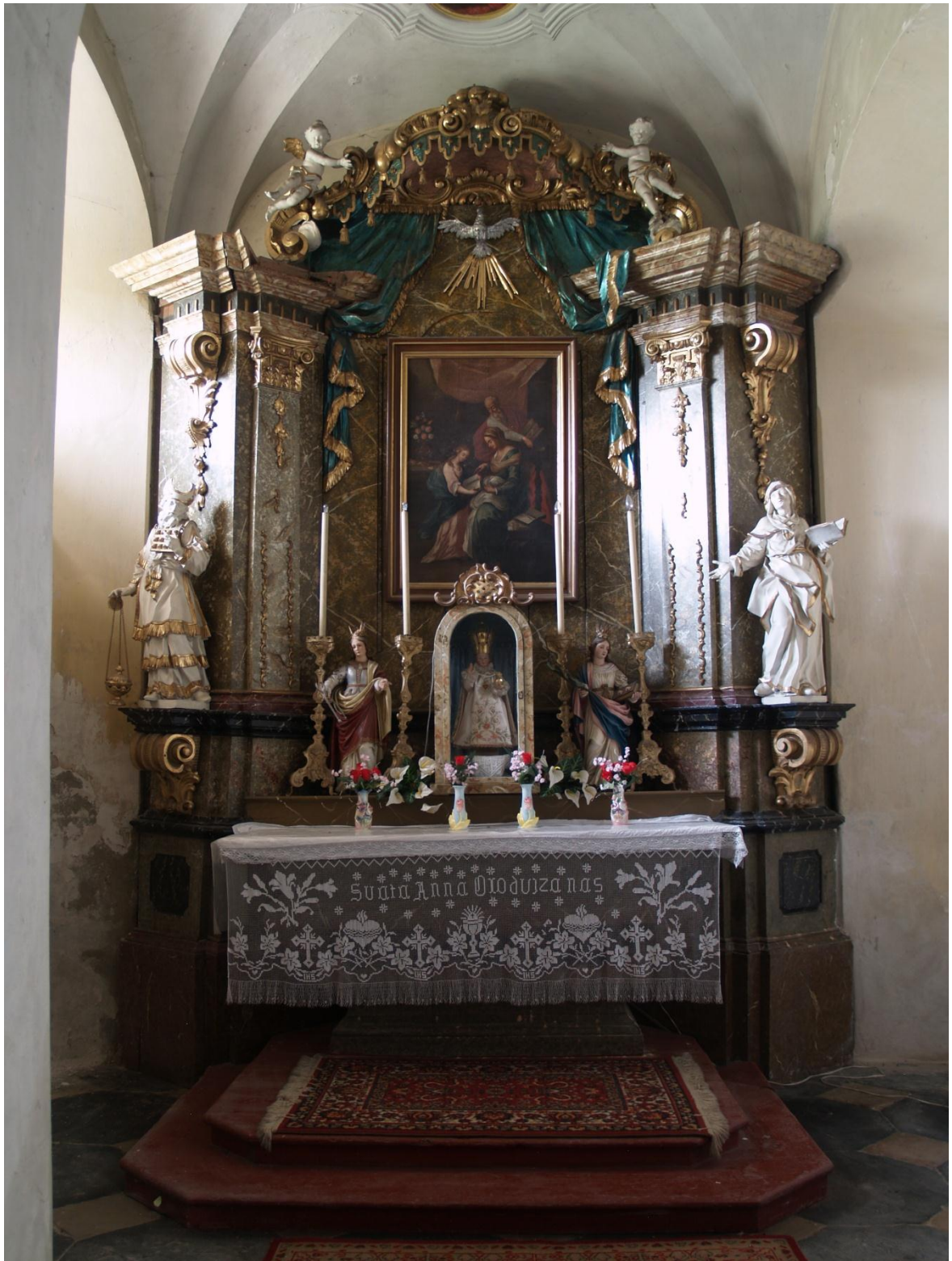
7) Kostel Očištvání Panny Marie v Dubu nad Moravou, kapele sv. Anny