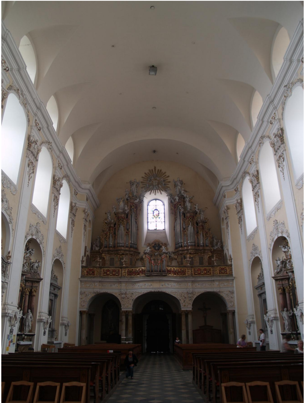
5) Kostel Očišťování Panny Marie v Dubu nad Moravou, kruchta s varhany na západní straně kostela, foto P. Antonín Basler