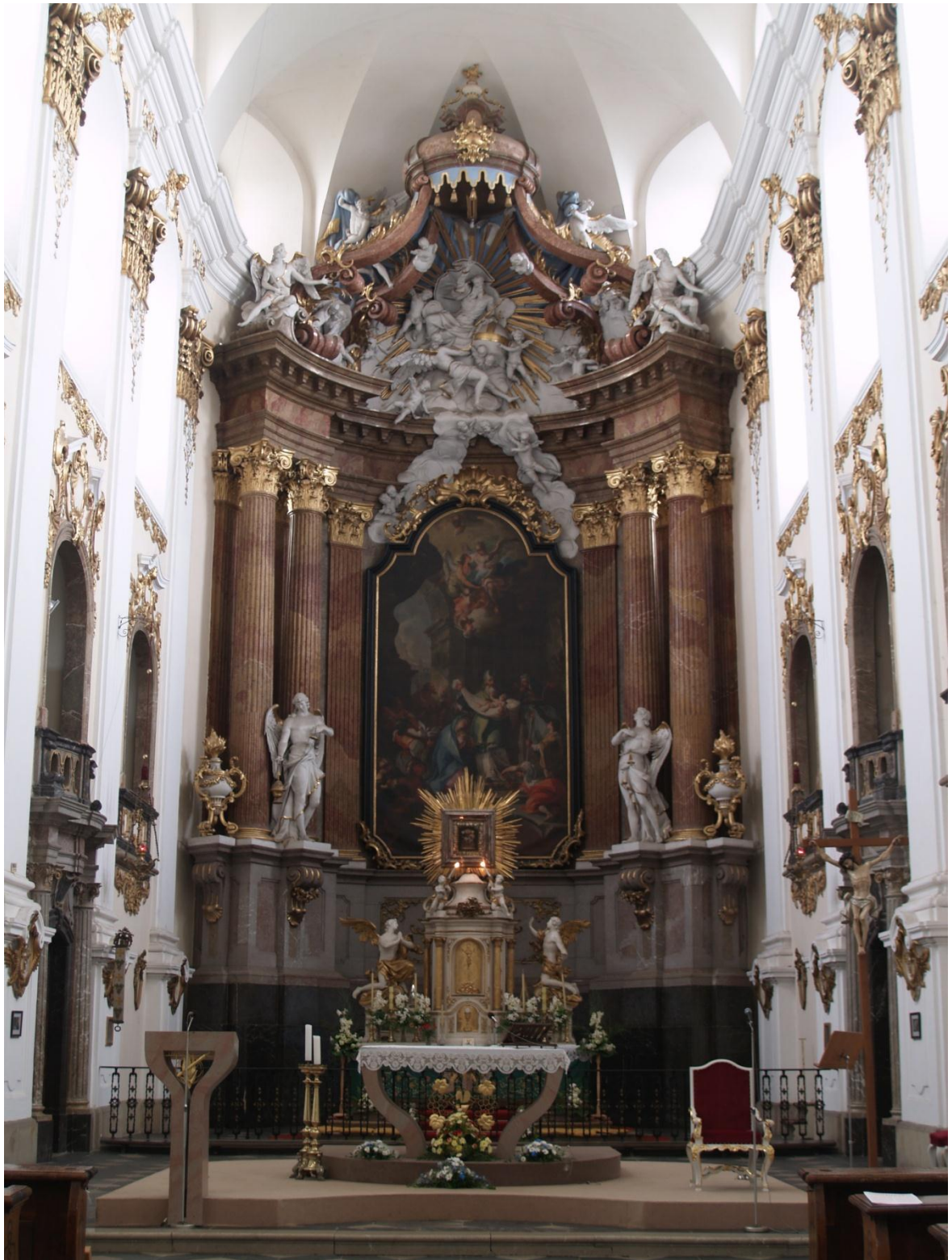
4) Kostel Očišťování Panny Marie v Dubu nad Moravou, hlavní oltář Očišťování Panny Marie z let 1747-1757