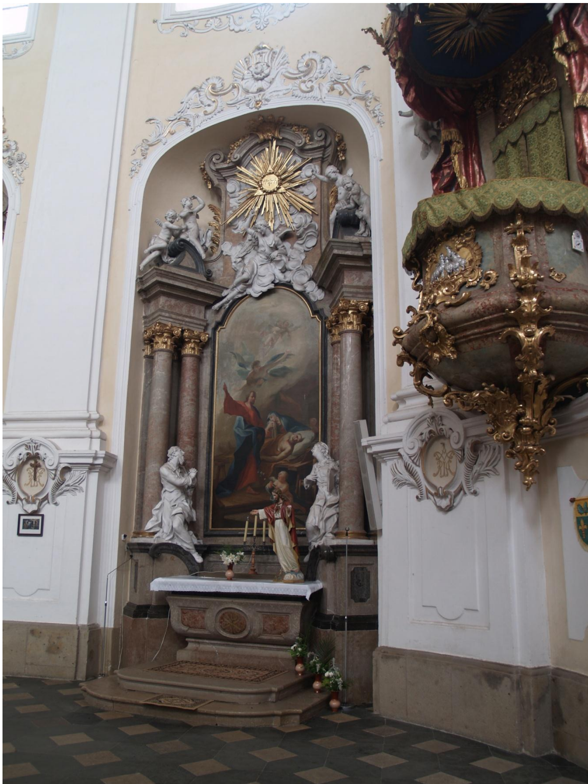
13) Kostel Očišťování Panny Marie v Dubu nad Moravou Evangelní strana – boční oltář sv. Josefa