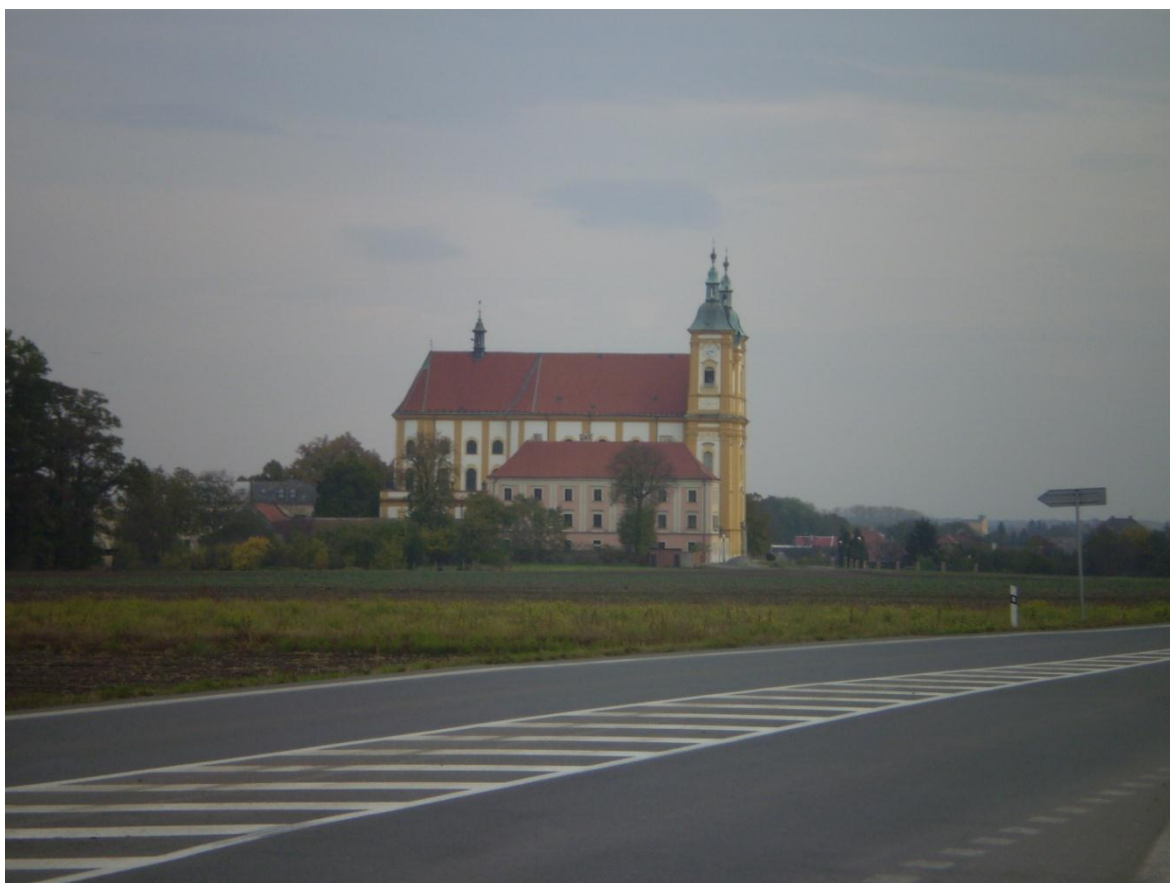
1) Kostel Očištvání Panny Marie v Dubu nad Moravou, pohled od severozápadu