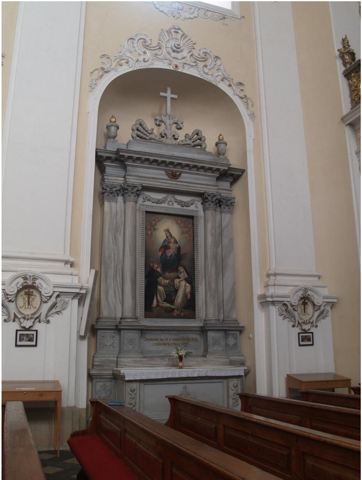
16) Kostel Očištvání Panny Marie v Dubu nad Moravou, epištolní strana - neoklasicistní boční oltář Panny Marie Růžencové