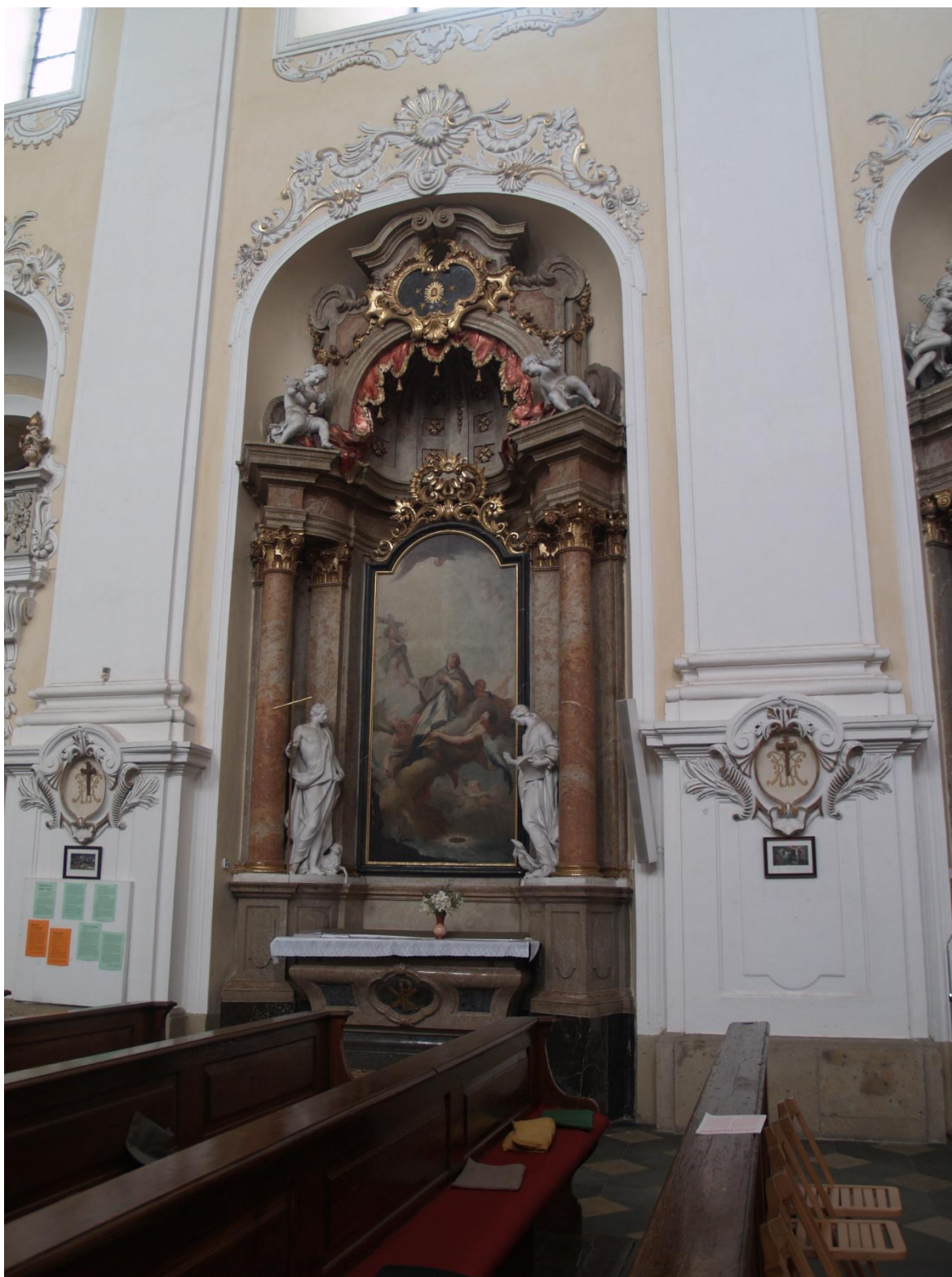
14) Kostel Očištvání Panny Marie v Dubu nad Moravou, evangelní strana – boční oltář sv. Jana Nepomuckého