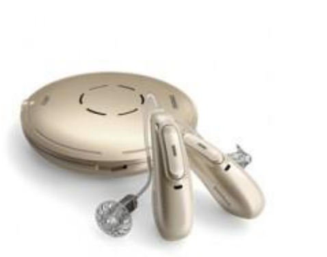
Obr. 6 Roger Select jiná varianta 68