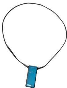
Obr. 8 Scolabuddy 70