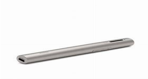
Obr. 5 Roger Pen 67