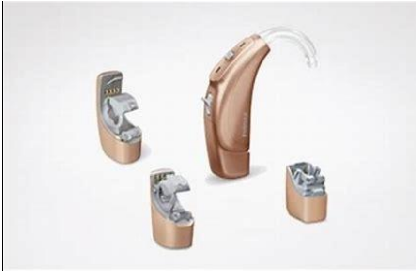
Obr. 4 Integrovaný přijímač Roger + sluchadlo 66