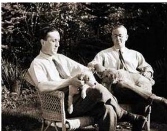
4 Bratři Čapkové