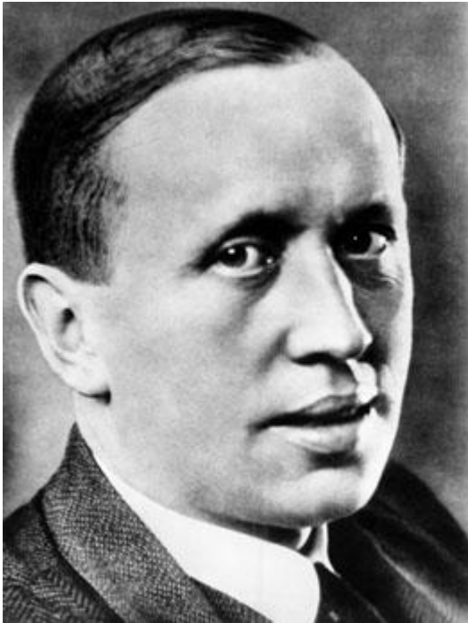
1 Karel Čapek