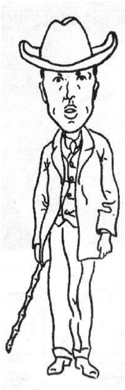
3 Karel Čapek- vlastní karikatura