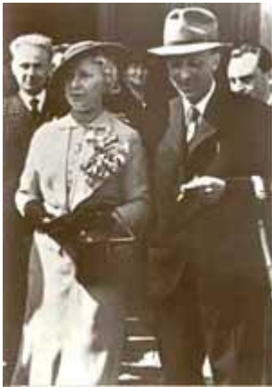
2 Karel Čapek a Olga Scheinpflugová