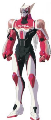
Barnaby Brooks Jr.