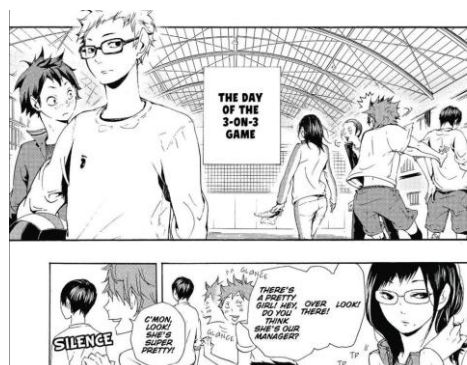
První vyobrazení Kiyoko v manze