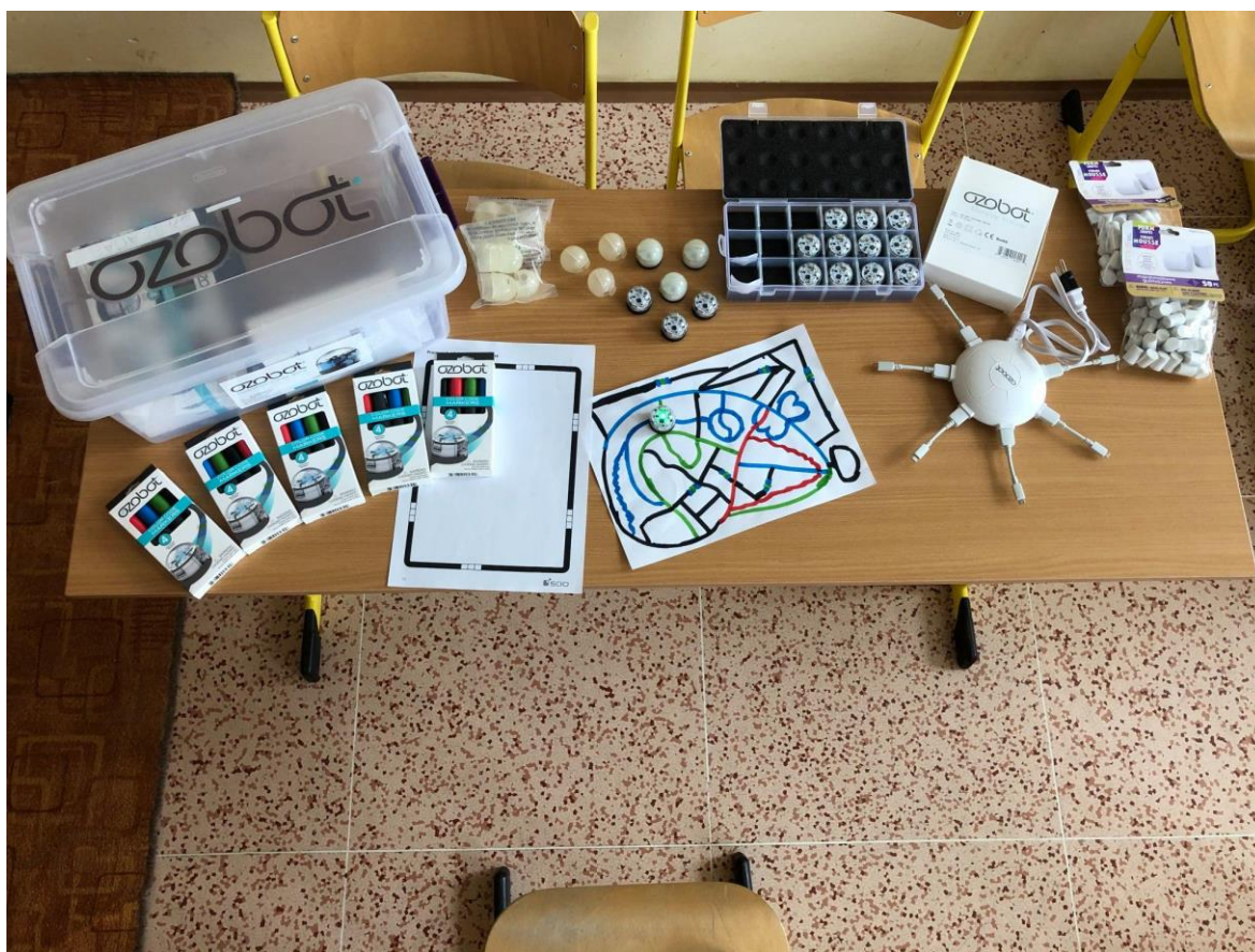
Příloha 3: Sada ozobotů – projekt Robotics moves the world