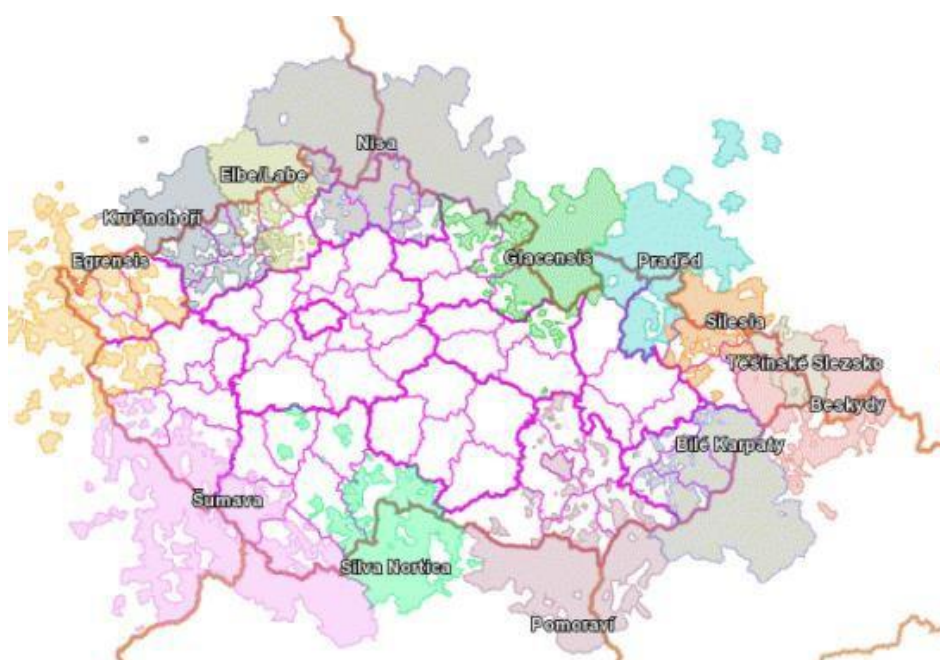
Obrázek 1 Mapa euroregionů v ČR

regiony, které sdílejí společné zájmy a výzvy. Euroregiony se zaměřují na spolupráci v oblastech jako jsou například obchod, investice, turismus, životní prostředí, doprava a kultura. V České republice existuje několik euroregionů, což jsou nadnárodní územní celky, které se skládají z území dvou nebo více států. Mezi euroregiony v České republice patří například Euroregion Glacensis, který spojuje české a polské regiony ležící na území Orlických hor a Kladského pomezí, Euroregion Nisa, který spojuje české, německé a polské regiony v okolí Lužických hor, nebo Euroregion Silesia, který zahrnuje český, polský a slovenský Slezský kraj. (Dušek, 2010)