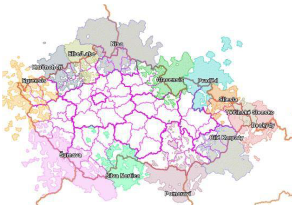
Obrázek 1 Mapa euroregionů v ČR

regiony, které sdílejí společné zájmy a výzvy. Euroregiony se zaměřují na spolupráci v oblastech jako jsou například obchod, investice, turismus, životní prostředí, doprava a kultura. V České republice existuje několik euroregionů, což jsou nadnárodní územní celky, které se skládají z území dvou nebo více států. Mezi euroregiony v České republice patří například Euroregion Glacensis, který spojuje české a polské regiony ležící na území Orlických hor a Kladského pomezí, Euroregion Nisa, který spojuje české, německé a polské regiony v okolí Lužických hor, nebo Euroregion Silesia, který zahrnuje český, polský a slovenský Slezský kraj. (Dušek, 2010)