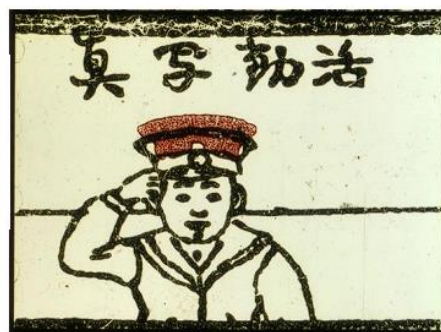
Obrázek 1: Kacudó šašin (Zdroj: F. Litten 73 )