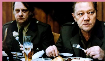
zdroj: Archiv TV Nova – Slavnosti sněženek