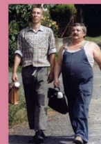
zdroj: Archiv TV Nova – Vesničko má středisková