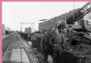
Vojáci stavebního praporu železničního vojska při stavbě Samovztyčitého kozaového jeřábu SKJ-10 na montážní základně v Dobrovicích u Mladé Boleslavi, rok 1987