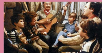
zdroj: ČT – S tebou mě baví svět

Co je doma, to se počítá, pánové... (1980) Za trnkovým keřem (1980) Postřižiny (1981) Pozor, vizita! (1981) Tajemství hradu v Karpatech (1981) Vrchlní, prchnil (1981) Jak svět přichází o básníky (1982) Sůl nad zlato (1982) Třetí princ (1982) Bota jménem Melichar (1983) O statečném kováři (1983) Sestřičky (1983) Slavnosti sněženek (1983) Slunce, seno, jahody (1983) Sněženky a machři (1983) S tebou mě baví svět (1983) Tři veteráni (1983) Lucie, postrach ulice (1984) S čerty nejsou žerty (1985) Stín kapradiny (1985) Vesničko má středisková (1985) Smrt krásných srnců (1986) Bony a klid (1987) Copak je to za vojáka (1987) Chobotnice z II. patra (1987) Discopříběh (1987) Jak básníkům chutná život (1987) Nejistá sezóna (1987) O princezně Jasněnce a létajícím ševci (1987) Kamarád do deště (1988) Člověk proti zkáze (1989) Dva lidi v ZOO (1989) Slunce, seno a pár facek (1989)