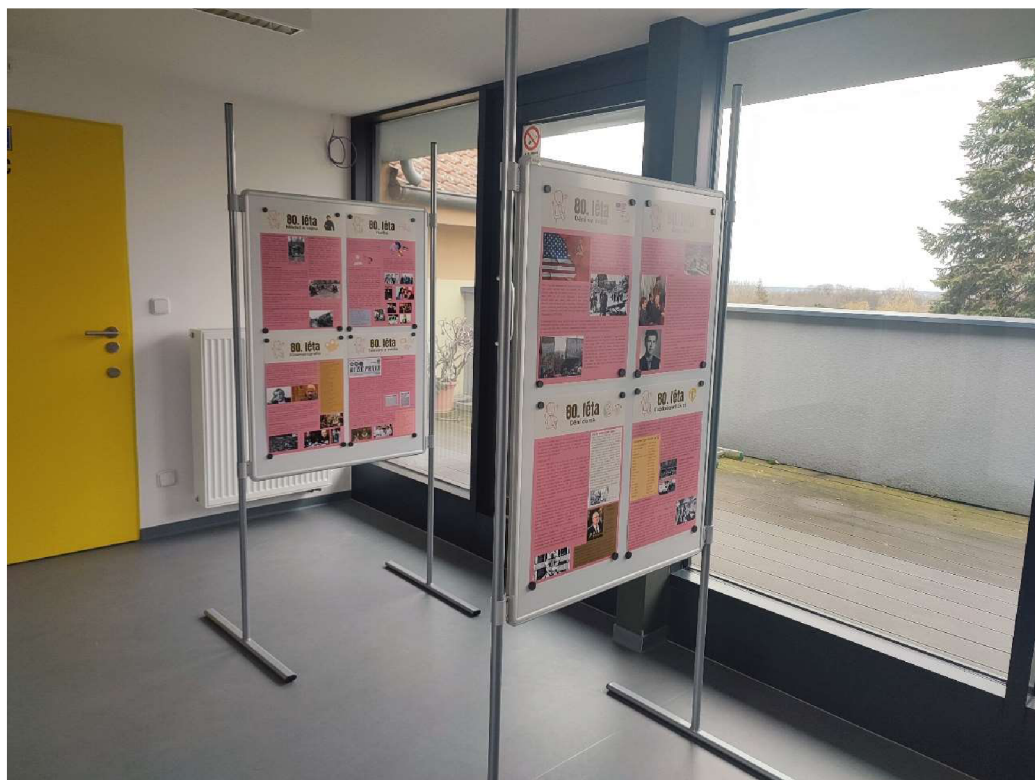
Příloha č. 3: Umístění výstavy v prostorách knihovny