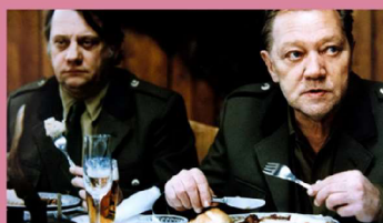
Slavnosti sněženek