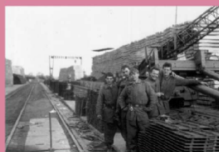
Vojáci stavebního praporu železničního vojska při stavbě Samozvycitelského kozového jeřábu SKI-10 na montážní základně v Dobrovicích u Mladé Boleslavi, rok 1987