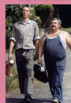
Vasničko má středisková