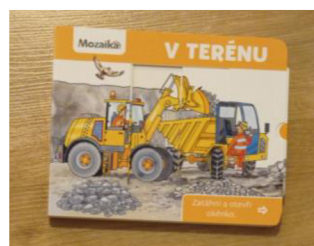
Obr. č. 4

Kniha o dopravních prostředcích, ale tentokrát v terénu. Díky této knize se děti dostanou do kamenolomu či do lesa a zjistí, jaké těžké stroje tam pracují a také, jak vevnitř vypadají, a to díky pohyblivým stránkám.