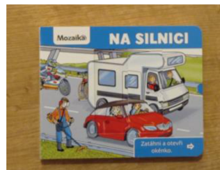
Obr. č. 3

Kniha o dopravních prostředcích, která zaujme nejen jednoho zvědavého čtenáře. Dvoustránka je vyhrazená pro daný dopravní prostředek, k jednotlivým obrázkům je přidán krátký text. Ilustrace prostředků jsou reálné, barevné a veselé. Knižka má pevné stránky, které se dají vysunout do strany, díky tomu se děti podívají i do interiérů vozů.