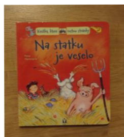
Obr. č. 7