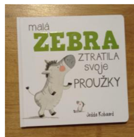
Obr. č. 6

Malá zebra prožila hrozný den, ztratila totiž svoje proužky. Hledala je všude, a ne a ne je najít. Kde by mohly asi být?! Pomůžete zebře je najít?