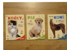
Obr. č. 8