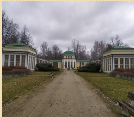
Natálie, 2020