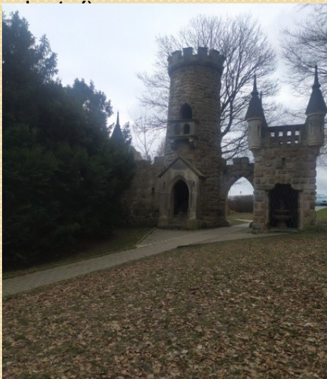
Rozhledna, 2020 (zdroj