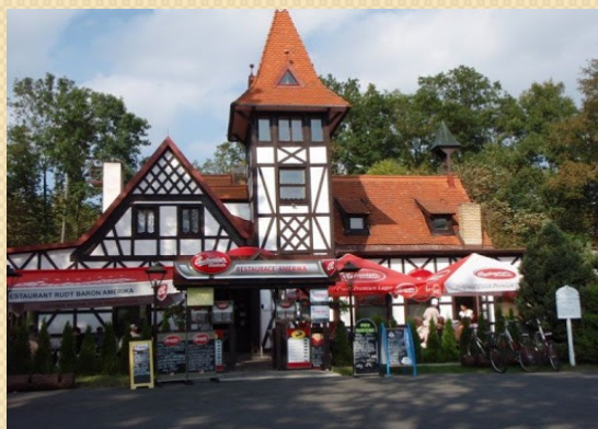
Kavárna Amerika, 2011, ( https://pohodaunas.webnode.cz/ )