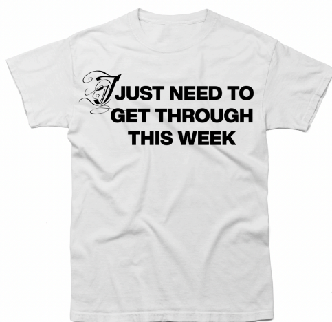
Obrázek 3 - Tričko „I just need to get through this week“

Prvním kusem bude ten nejlevnější, tričko s názvem „I just need to get through this week“. Design na tričku je jednoduchý, ale má jasný záměr. Všichni jsme si někdy řekli, že už je skoro konec týdne, že už ten zbytek zvládneme, ale ve skutečnosti je to stále se opakující cyklus ze kterého lze ven pouze vlastní vůlí a není to něco, co by přešlo.