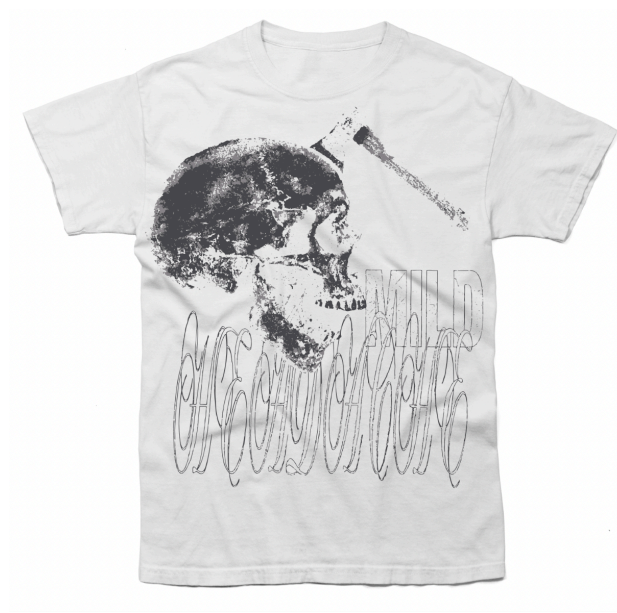
Obrázek 4 - Tričko „Mild Headache“

Druhým kusem z kolekce bude také tričko, ale již z kvalitnějších materiálů a s jiným střihem. Tričko bude potištěno DTG tiskem, protože se v designu nachází více, než dvě barvy. Tričko bude decentně zkrácené na spodní části břicha, aby působilo proporčně a esteticky lépe. Tričko má název „Mild headache“, což v překladu do češtiny znamená „mírná bolest hlavy“. Všem se nám stalo že někdo nám blízký vypadal sklesle, přešle nebo smutně ale když jsme se zeptali co se děje, smetl to ze stolu, nebo to zjednodušil, abychom o něj neměli strach. Sekyra zaseknutá v lebce vyznačuje přesně to co člověk v tu chvíli cítí. Ví že potřebuje pomoci, ale neví jak si o ni říct, tak nechá sekyru v hlavě a nazve to mírnou bolestí hlavy.