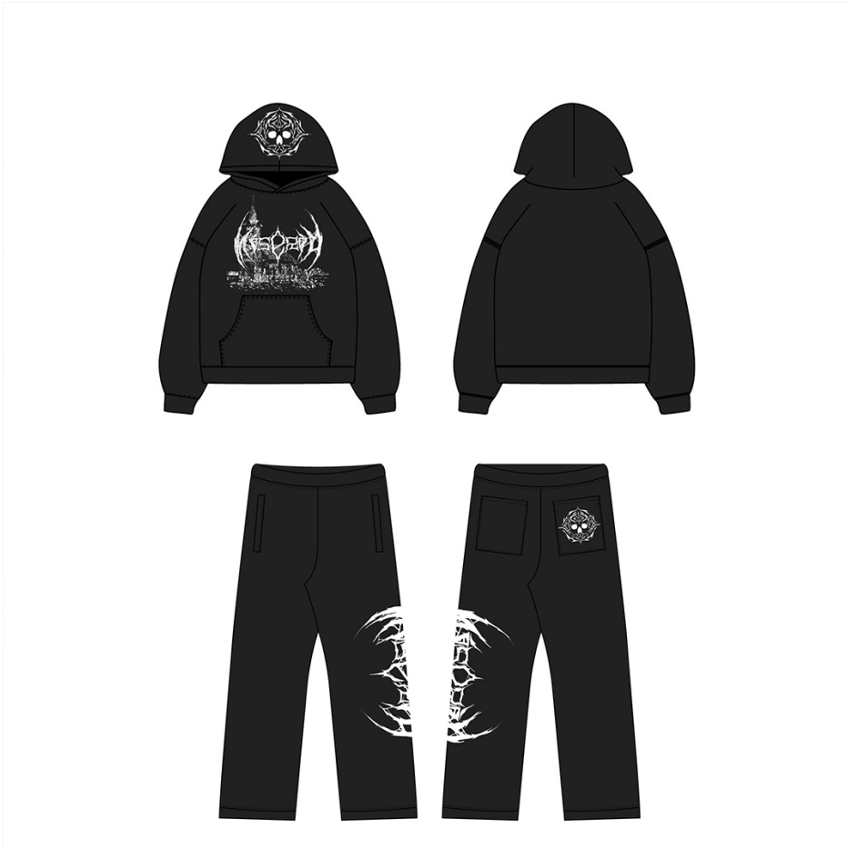
Obrázek 5 - Tepláková souprava

AAKER, David A. Brand building: budování značky : vytvoření silné značky a její úspěšné zavedení na trh. Business books (Computer Press). Brno: Computer Press, 2003. ISBN 80-7226-885-6.