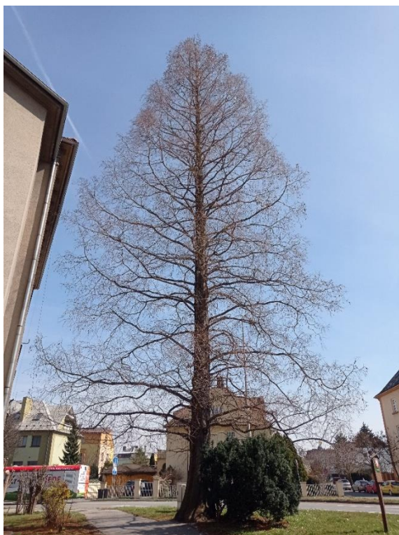
Obrázek 12 - metasekvoje na Střelnici