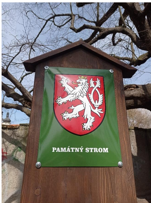
Obrázek 4 - informační tabulka

Památné stromy by v terénu měly být označeny tabulemi s malým státním znakem České republiky. Tyto tabule by se měly nacházet v bezprostřední blízkosti stromu, aby bylo na první pohled zřejmé, o který strom se jedná. S nápisem „památná strom“ nebo „ památné stromy“.