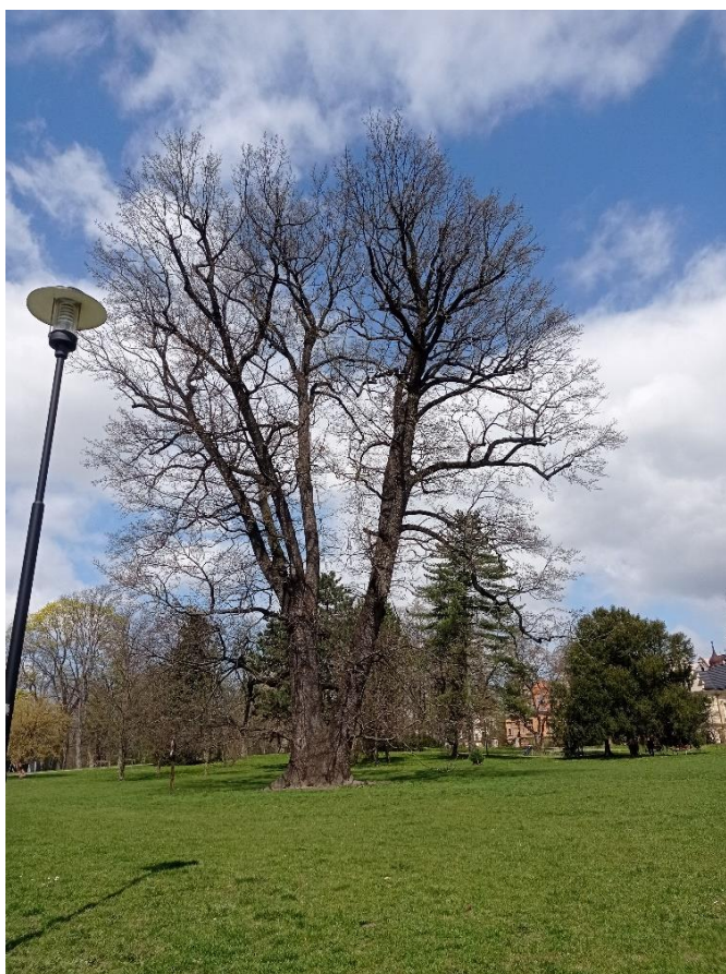
Obrázek 15 - Rudolfov dub