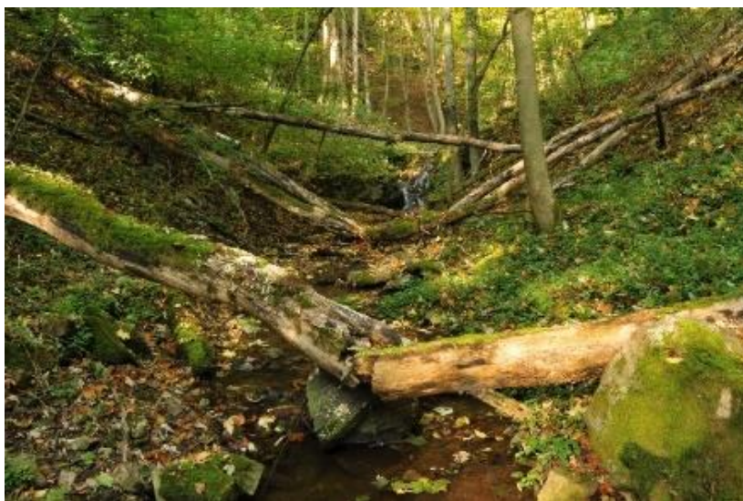
Obrázek 3 - mrtvé dřevo

České lesy se kácí průměrně po 115 letech, duby a buky o několik desítek let později. Přirozeně se ovšem stromy dožívají několikanásobně delšího věku: buky 200-400 let, smrky 350-400 let, a dub a jedle okolo pětiset let. Při takto rychlém kácení celých lesů, nemají stromy možnost zestárnout. (Bláha, Štroufová, Poštulka, & Kotlecký, 2008)