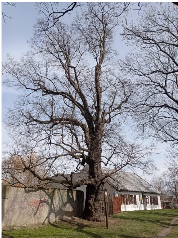
Obrázek 9 - lípa u Klášterního Hradiska