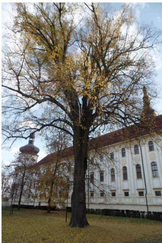
Obrázek 16 - špitálská lípa sv. Štěpána