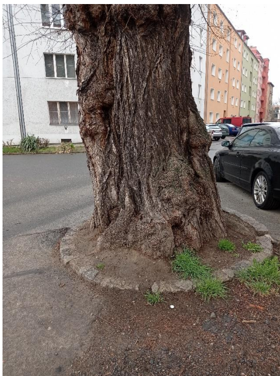
Obrázek 5 - jilm na Charkovské, nedostatek místa

O stupeň lépe (krátkodobě perspektivní) jsou na tom stromy: Čajkovského lípa, lípa u Klášterního Hradiska a metasekvoje na Nových Sadech. Čajkovského lípa vypadá poněkud zanedbaným dojmem, nejvíce ze všech památných stromů v Olomouci. Větve stromu se hodně kroutí směrem k zemi, a mnoho větví (suchých i polosuchých) leží až na zemi. Na lípě by se měly provést vhodné řezy, popřípadě zvážit i instalace bezpečnostních podpěr. Lípa u Klášterního Hradiska, působí již „starým“ dojmem, strom je ale na první pohled náležitě ořezáván. Nicméně do budoucna by se mělo zvážit zbourání betonové zdi, která je v těsné blízkosti stromu, a leží na ní i jedna větev. Když by se zeď zbourala, vytvořilo by to tak vhodnější místo pro neomezený růst a mohutnění stromu. Metasekvoje na Nových Sadech má kratší perspektivu z důvodu velmi blízkého růstu u cesty (podobně jako jilm na Charkovského ulici). Tato metasekvoje sice není zcela obehnána asfaltem, pouze z jedné strany, z druhé strany je travnatý pozemek. Ale i tato jedna strana překážky by mohla do budoucna negativně ovlivňovat růst a vitalitu stromu.