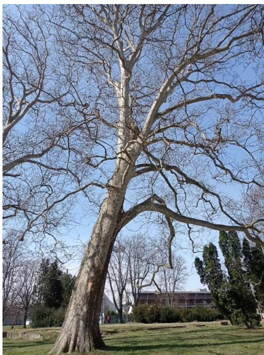
Obrázek 14 - platany v ASO parku 2