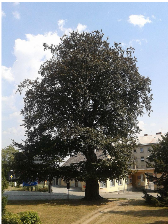
Obrázek 17 - buk u staré vrátnice