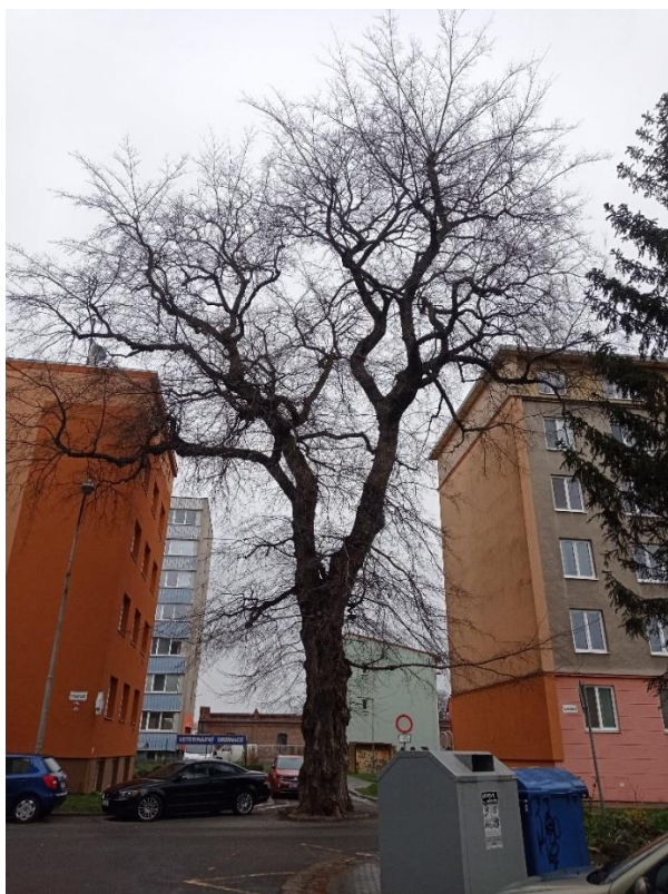
Obrázek 8 - jilm na Charkovského