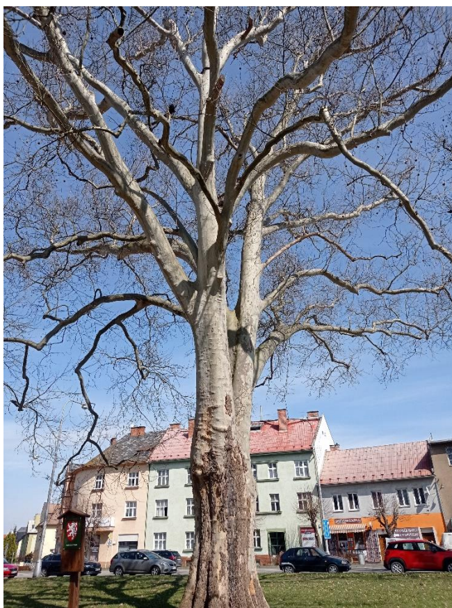
Obrázek 13 - platany v ASO parku 1