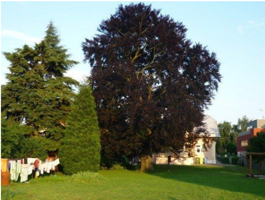
Obrázek 7 - Chválkovický buk