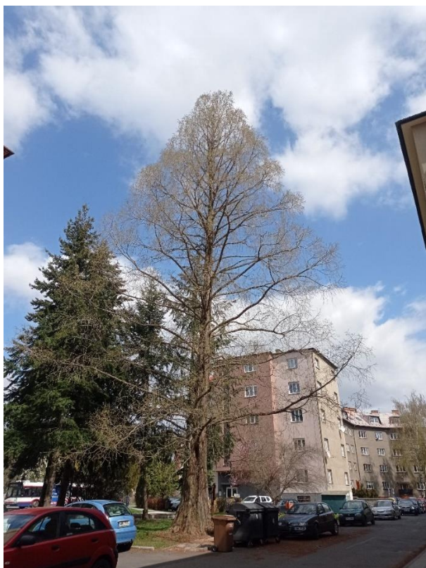
Obrázek 11 - metasekvoje na Nových Sadech