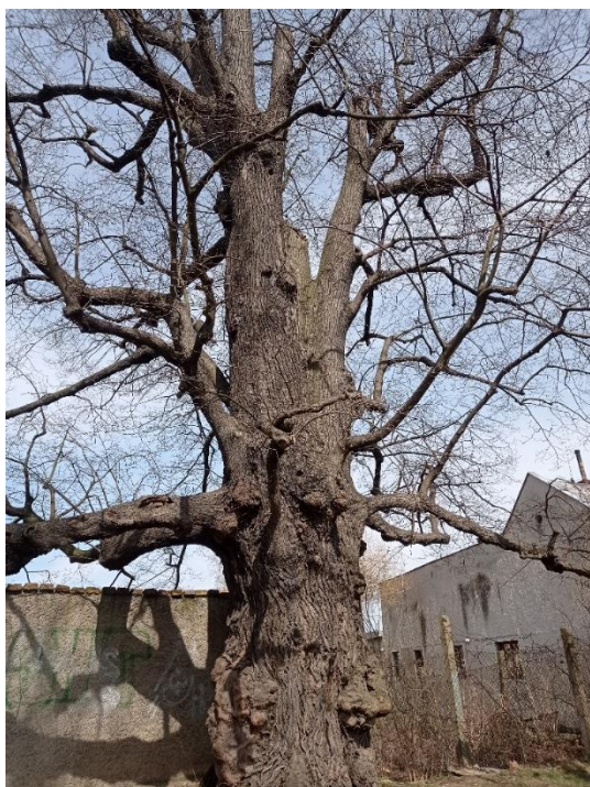
Obrázek 10 - lípa u Klášterního Hradiska - detail