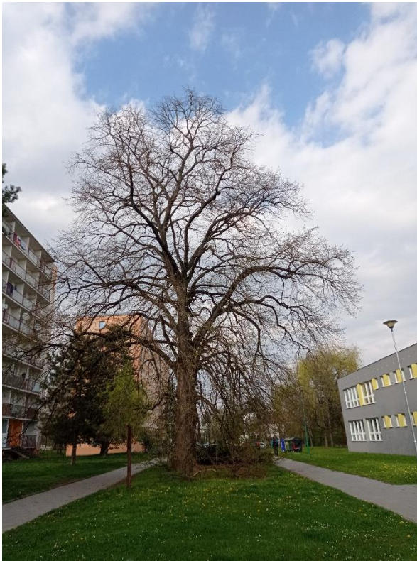
Obrázek 6 - Čajkovského lípa