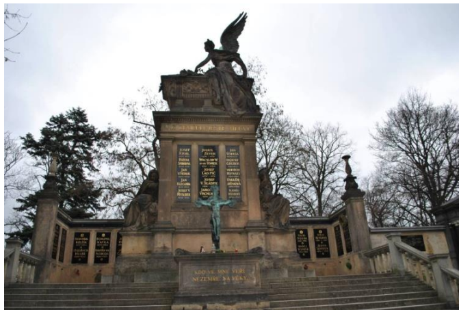
Obrázek č. 16: Čertovy kameny.