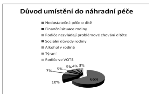
Obrázek 1: Důvod umístění do náhradní péče.