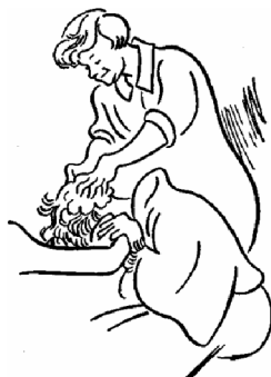
Zweitens : Frau Friseurse Tischbein, Emils Mutter

Daraufhin schildert er schrittweise den Entstehungsprozess und beschreibt detailliert die einzelnen Einfälle (Emil, die Großmutter, Pony Hütchen, die Bankfiliale etc.), die z.T. aus dem Alltag und autobiographischen Ursprungs sind. Indem er die einzelnen Ideen seiner Geschichte in Begleitung von Bildern erklärt, erinnert das Vorhaben an vereinzelte Zeitungsausschnitte (bestehend aus Bild, Titel und Erläuterung). Es erfüllt scheinbar die Funktion einer Vorwegnahme der wichtigsten Informationen, die so ‚nackt‘ dargestellt, die Spannung und Neugierde der Leser anzuregen haben, um sie zum Weiterlesen und Erfahren der entsprechend Details zu bewegen. Einige dieser Auszüge 307 werden an dieser Stelle zur Veranschaulichung herangezogen: