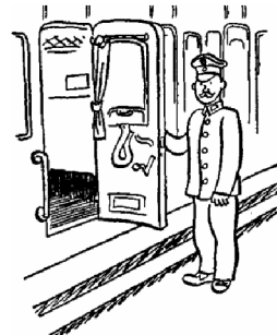
Drittens : Ein ziemlich wichtiges Eisenbahnabteil

Als Emil fünf Jahre alt war, starb sein Vater, der Herr Klempnermeister Tischbein. Und seitdem frisiert Emils Mutter. Und onduliert. Und wäscht Ladenfräuleins und Frauen aus der Nachbarschaft die Köpfe. Außerdem muß sie kochen, die Wohnung in Ordnung halten, und auch die große Wäsche besorgt sie ganz allein. Sie hat den Emil sehr lieb und ist froh, daß sie arbeiten kann und Geld verdienen. Manchmal singt sie lustige Lieder. Manchmal ist sie krank, und Emil brät für sie und sich Spiegeleier. Das kann er nämlich. Beefsteak braten kann er auch. Mit aufgeweichter Semmel und Zwiebeln.