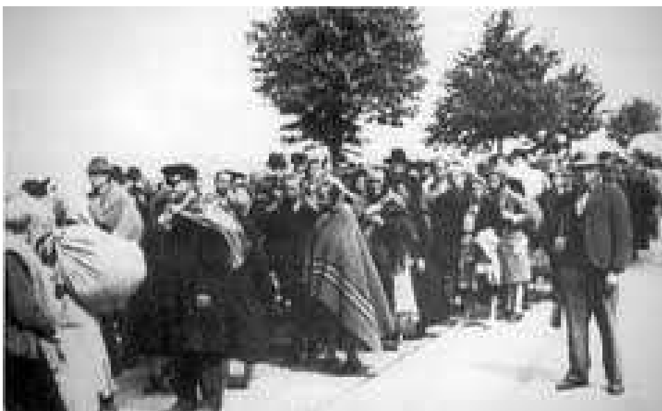
Obrázek č. 10 Organizovaný odsun

K odsunu byly stanoveny takovéto podmínky: