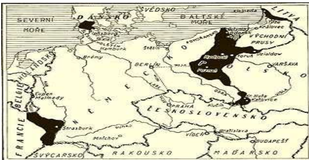
Obrázek č. 4 Územní ztráty Německa v důsledku Versailleské smlouvy (vyznačeny černou barvou)

Tedy v této době již nic nebránilo tomu, aby se 15. - 16. června 1919 konaly volby do obecních zastupitelstev, kterých se účastnili i Němci. Tyto volby skončili prakticky ve všech oblastech státu včetně okresů obývaných převážně německou populací vítězstvím levice. 11 Podle řady historických interpretací to znamenalo faktické uznání existence československého státu, současně se stal definitivním impulzem k transformaci politického života českých Němců, která byla završena o měsíc později odchodem jejich poslanců z vídeňského parlamentu po podpisu mírové smlouvy v Saint-Germain en Laye, která byla také jedna se zásadních smluv, podepsaných po skončení I. světové války.