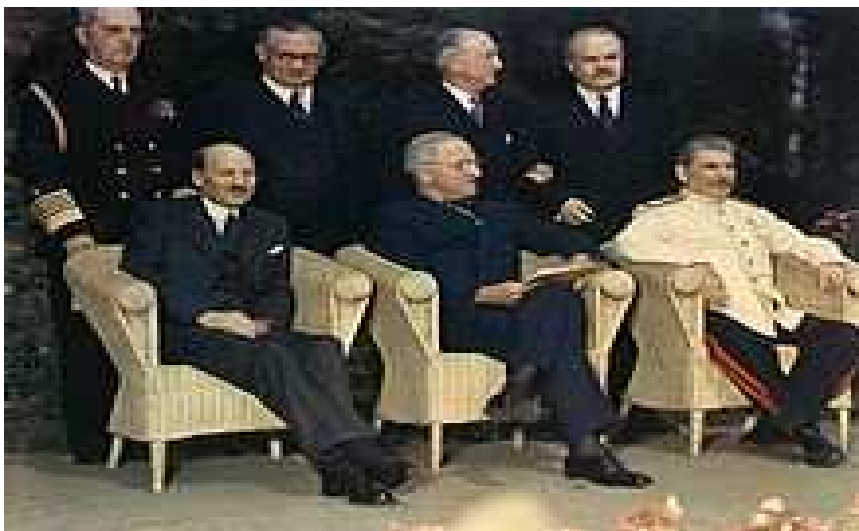
Obrázek č. 8 Zástupci velmocí na Postupimské konferenci (sedící zleva: Clement Attlee, Harry Truman, Josef Stalin)

musí probíhat spořádaně a hlavně lidsky. Všechny tři země byly vyzvány, aby prozatím zastavily probíhající vyhošťování.