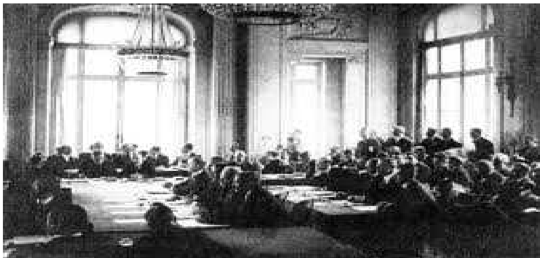
Obrázek č. 3 Pařížská mírová konference ve Versailles.

kteřou tvořili klíčové mocnosti oficiální požadavky československého státu. Mezi ně náleželo také udržení historického celku někdejšího českého státu včetně pohraničních oblastí obývaných českými (sudetskými) Němci.