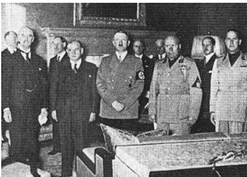
Obrázek č. 5 Představitelé čtyř mocností na jednání v Mnichově.

Dnem 30. Zář 1938 bylo rozhodnuto. Takzvaně „Mnichovská dohoda“ stvrdila konec Československa jako samostatného a demokratického státu. Je zde nutno dodat, že k samotnému jednání čtyř mocností (Francie, Německo, Anglie, Itálie) nebyla Československá strana přizvána a mohla jen sedět ve vedlejší místnosti čekajíc na verdikt. Odtud známa to věta „O nás bez nás“.