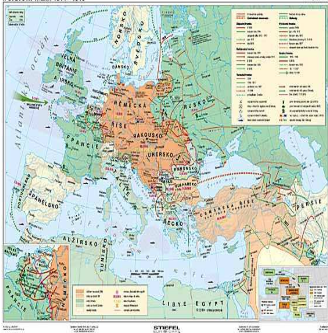
Obrázek č. I. Světová válka 1914-1918.