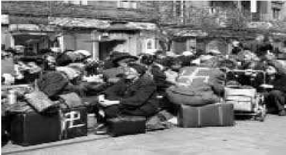
Obrázek č. 7 Tzv. Divoký odsun Němců z ČSR

Chaotická situace nutně poznamenala i počáteční snahy o neregulovaný, živelný, tzv. divoký odsun Němců, což bylo vyhošťování německého obyvatelstva od konce května do počátku srpna 1945 prováděné místními revolučními orgány, československými a sovětskými veliteli. Vyhošťování neprobíhalo v oblasti obsazené americkou armádou. Odsun, který se v této fázi týkal asi 660 000 Němců, směřoval do oblasti sovětské okupační zóny v Německu a v Rakousku. Pokusy o odsun německého obyvatelstva na dnešní polské území byly zastaveny polskou armádou, takže bylo vyloučeno německé obyvatelstvo od Těšína po Zhořelec. Vlastní odsun se týkal oblasti od Litoměřic po Karlovy Vary a z jižní Moravy a Čech (od Břeclavi po Kaplicko). Výběr osob pro vyhoštění byl záležitostí právě jen těchto revolučních jednotek a orgánů. Převážně se týkal osob nějak mimořádně zkompromitovaných (např. funkcionáři nacistických organizací) a Němců, kteří se na odstoupená území přistěhovali po 1. říjnu 1938 z území Říše. Jednou z největších akcí divokého odsunu se stal pochod asi 20 000 Němců z Brna do Rakouska, který se vyžádal přes 600 obětí. Impulzem k násilí proti Němcům se stala doposud plně neobjasněná exploze munice uskladněné ve velkém skladu v Krásném Březně