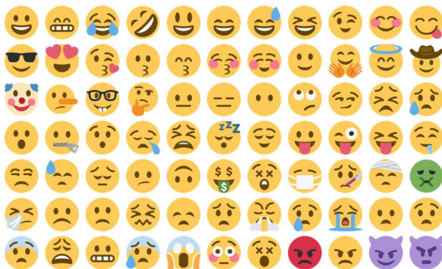
Obrázek 3 Emotikony

Na platformě Twitter se vyskytuje široké spektrum různých emotikonů, které jsou pravidelně aktualizovány a vytvářeny další. Na obrázku č. 3 jsou znázorněny některé emotikony, které Twitter vystavil v roce 2016.