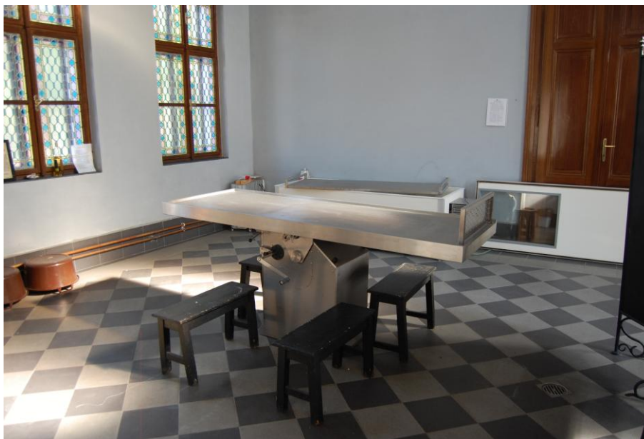
Obrázek 5: Nový nerezový stůl na taharu