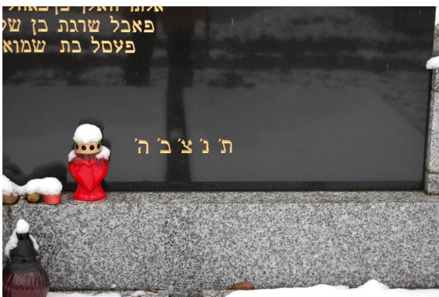
Obrázek 10: Tanceva