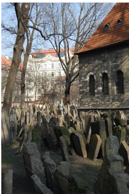
Obrázek 14: Starý židovský hřbitov v Praze