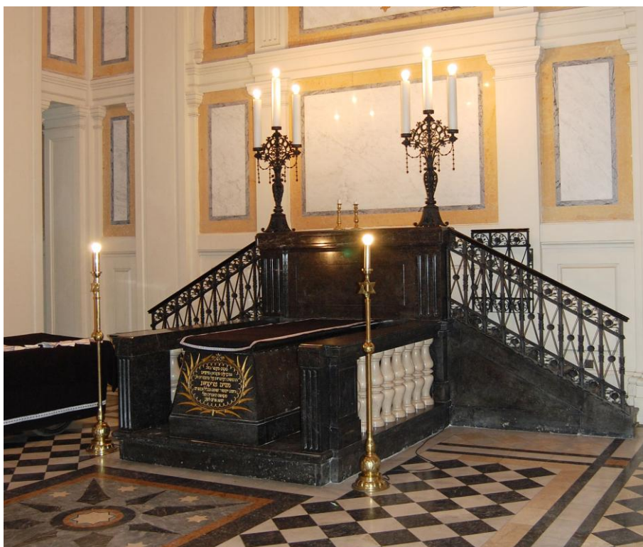
Obrázek 2: Katafalk