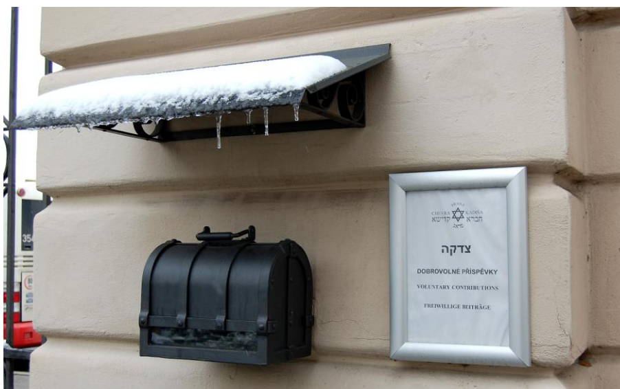
Obrázek 12: Kasička na almužny