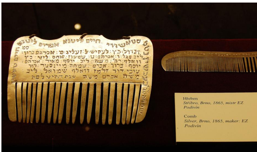
Obrázek 6: Stříbrný hřebínek na taharu v expozici Židovského muzea v Praze