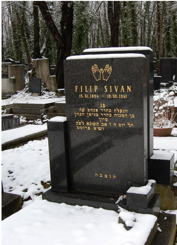
Obrázek 7: Symbol rodu Kohenů