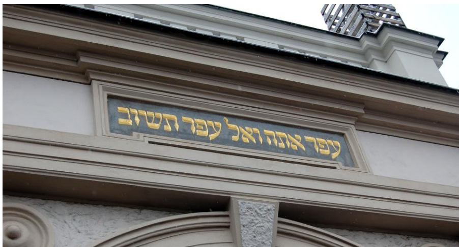
Obrázek 11: Prach jsi a v prach se navrátíš