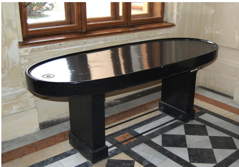
Obrázek 4: Původní stůl na taharu