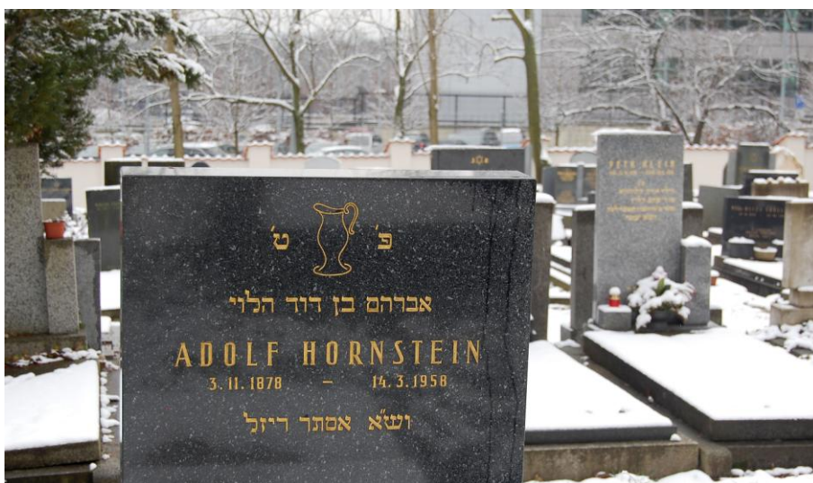
Obrázek 8: Symbol rodu Levitů