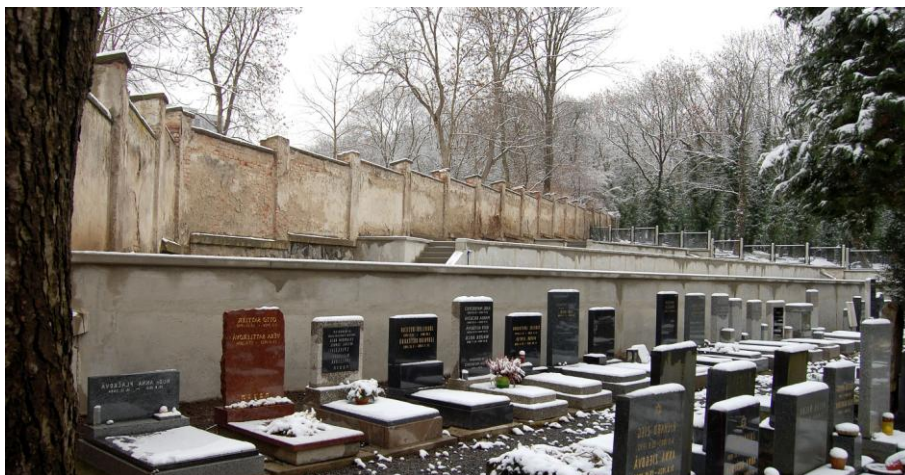
Obrázek 13: Urnové oddělení na Novém židovském hřbitově v Praze