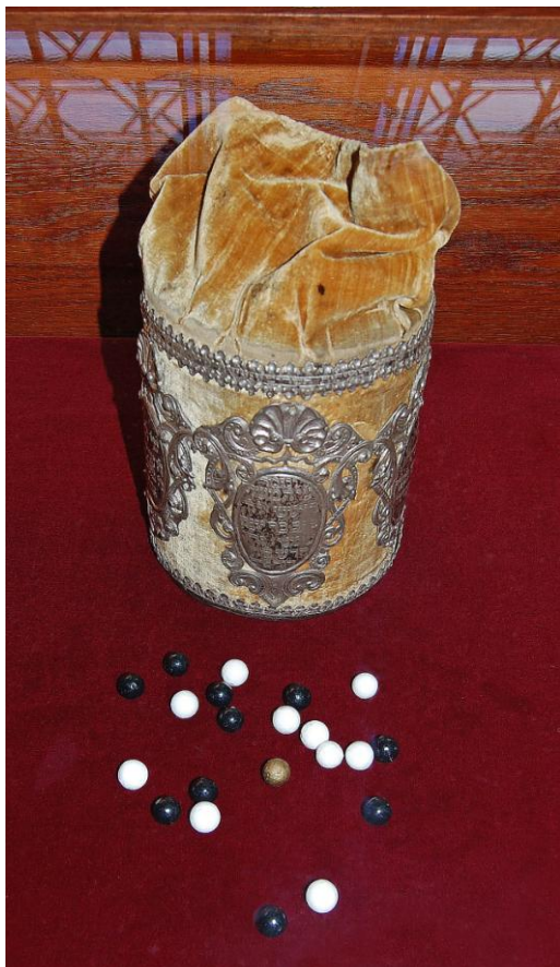
Obrázek 15: Volební urna na Balotáz