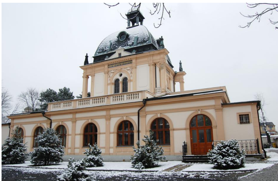
Obrázek 1: Obřadní síň Nového židovského hřbitova v Praze