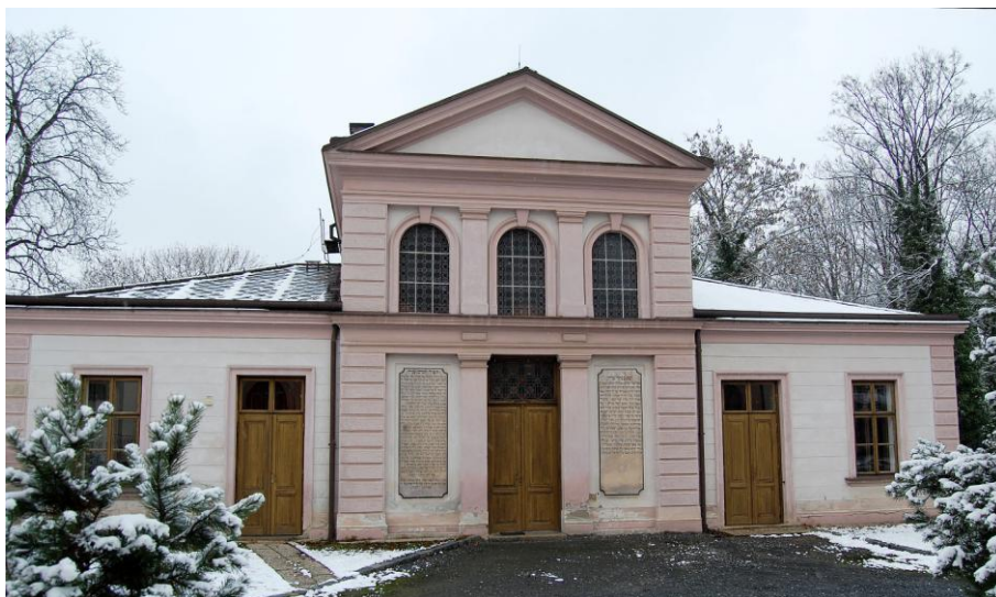
Obrázek 3: Budova zřízená pro účely tahary