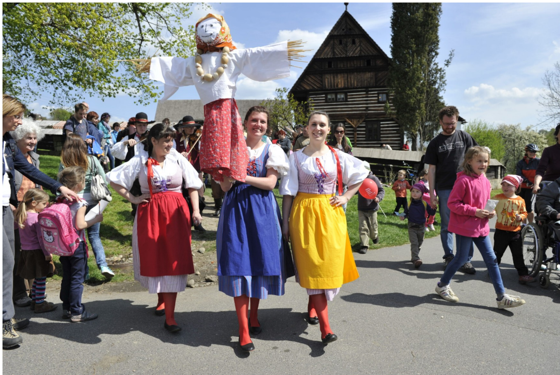
Obr. 1 – Vynášení Morana.

1) Prohlédni si obrázek a ve dvojici prodiskutuj, co se na něm odehrává. Napiš si k tomu poznámku: