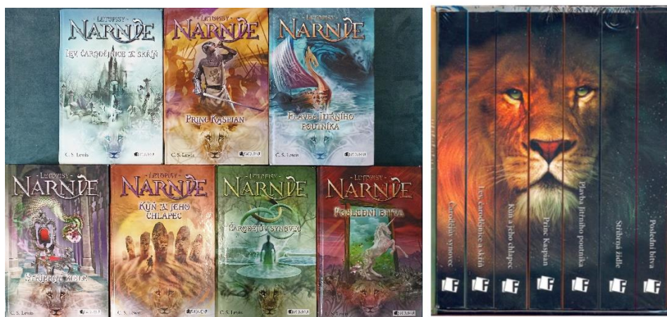
Obr. 3: Vydání z let 2005-2006 v nakladatelství Fragment s ilustracemi od Pauline Baynesové a s obálkami od Cliffa Nielsena v pořadí, v jakém byly knihy napsány