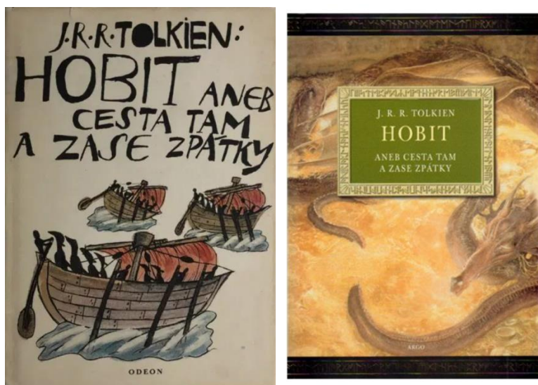
Obr. 1: Vydání z roku 1991 v nakladatelství Odeon s obálkou Jiřího Šalamouna