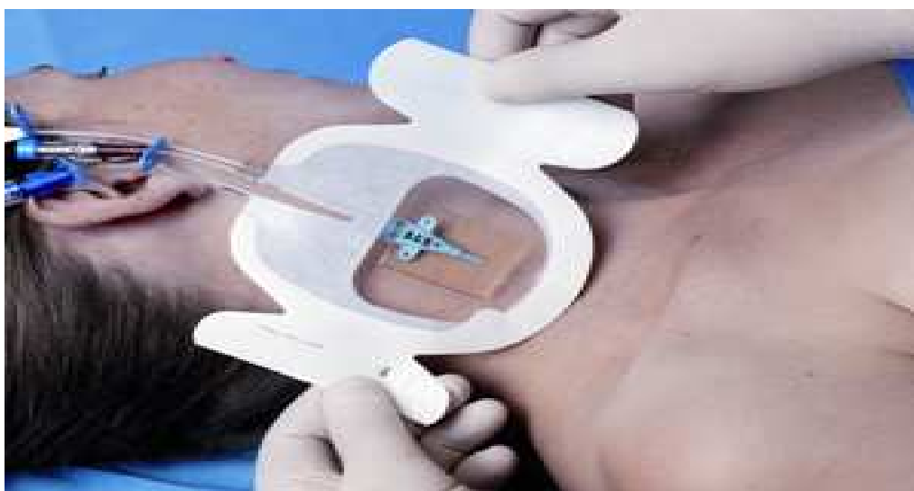
Obrázek 6 Ošetřený a fixovaný centrální venózní katétr

Praktický, bezpečný a rychle dostupný bezjehlový vstup pro injekci, aspiraci nebo paralelní infuzi – uzavřený systém.