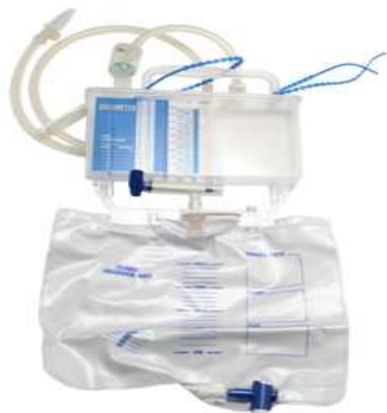
Obrázek 4 Uzavřený systém pro sběr moče – prevence močové infekce