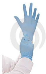
Obrázek 2,3 Ochranné pomůcky zdravotnického pracovníka