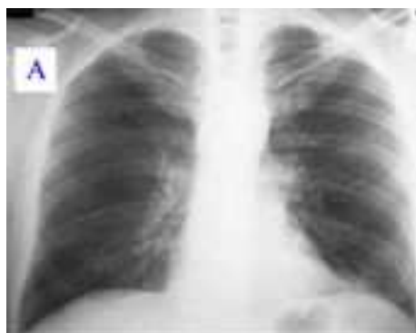
Obrázek 9 Ukázka RTG snímku při pneumónii