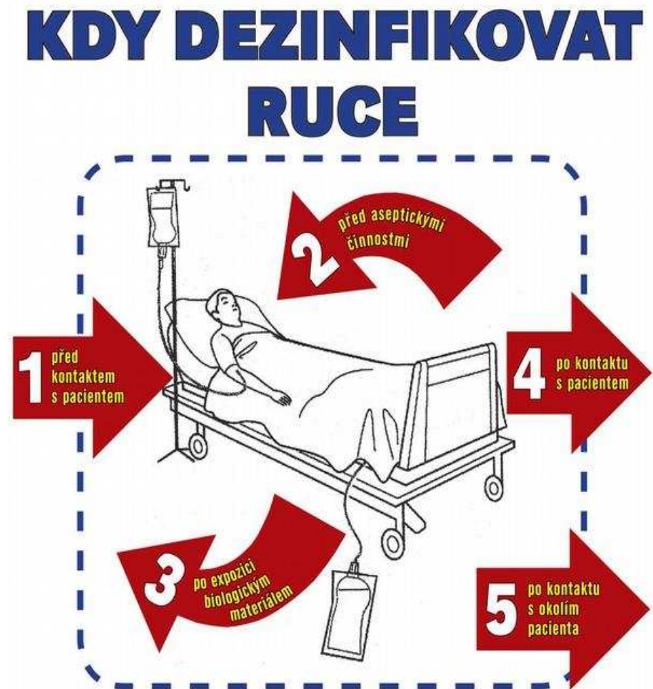
Obrázek 1 Schéma kdy dezinfikovat ruce