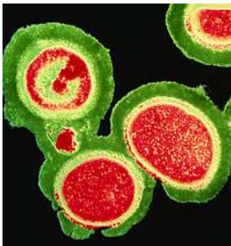
Obrázek 10 MRSA - izolované bakterie