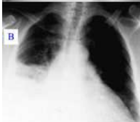
RTG plic - pneumónie