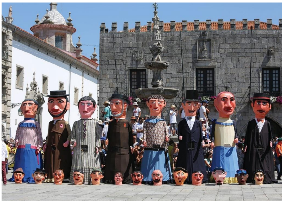
Obrázek č. 6 Tradiční masky „gigantones“ ve Viana do Castelo