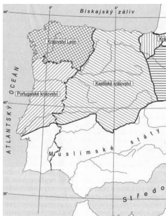
Obrázek č. 4 Rozložení portugalského království kolem roku 1170

galicijskému nátlaku, ale neúspěšně. V roce 1121 tento Galicijec převzal vládu nad portugalským hrabstvím. V roce 1127 začalo otevřené povstání proti Tereze a rodu Travasů, v jehož čele stál Afonso Henriques (její syn). V tomto roce dochází v souvislosti s portugalským hrabstvím k největšímu soupeření mezi „galicijskou“ a „portugalskou“ stranou, protože Afonso Henriques zastával názor, že Galicie a Portugalsko jsou dvě země. V roce 1140 se Afonso prohlásil králem a po dobu několika let stále napadal Galicii s cílem povýšit portugalské hrabství na království. O tři roky později je v Zamoře uzavřena dohoda. Tato dohoda znamenala definitivní uznání statusu Portugalska jako plně nezávislého království na poloostrově. Portugalsko tedy vzniklo jako nezávislé království během 12. století. Ke konci 13. století je podepsána první právní listina týkající se hranic mezi oběma stranami, díky které tak Portugalsko dosahuje víceméně hranic současných. Od počátku 14. století se pak začíná používat raná forma portugalštiny. Portugalština byla složeným jazykem, který převzal svou strukturu a většinu slovní zásoby z galicijsko-portugalštiny, která se v této době používala na severozápadě poloostrova. 80