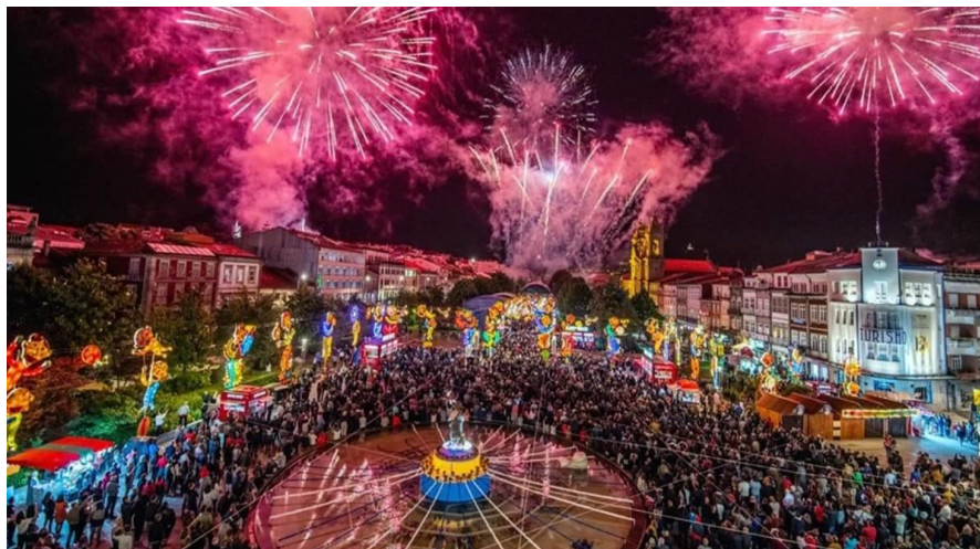
Obrázek č. 7 Oslavy na počest São João

největšími slavnostmi ve městě, a to díky zapojení městské rady a obchodního sdružení města. Je možné pozorovat zvyšující se počet akcí, zapojených institucí a zúčastněných lidí a počet diváků. 129 I v Braze lze vidět již výše zmiňované „gigantones“. Konají se průvody, koncerty a nejrůznější výstavy. Festival je zakončen velkolepými ohňostroji.