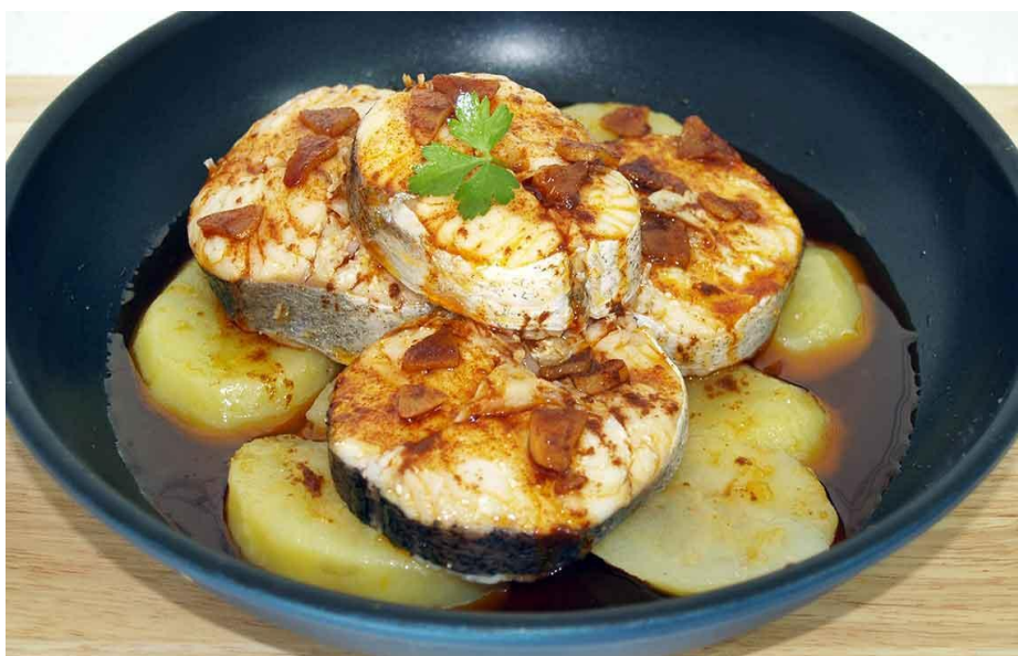
Obrázek č. 11 Pescada Galega