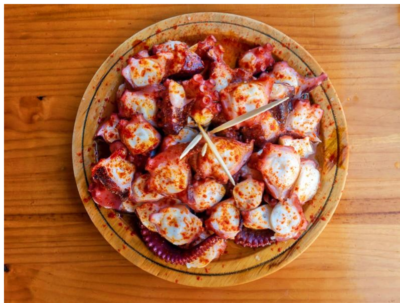
Obrázek č. 9 Polbo á feira – tradiční galicijský pokrm