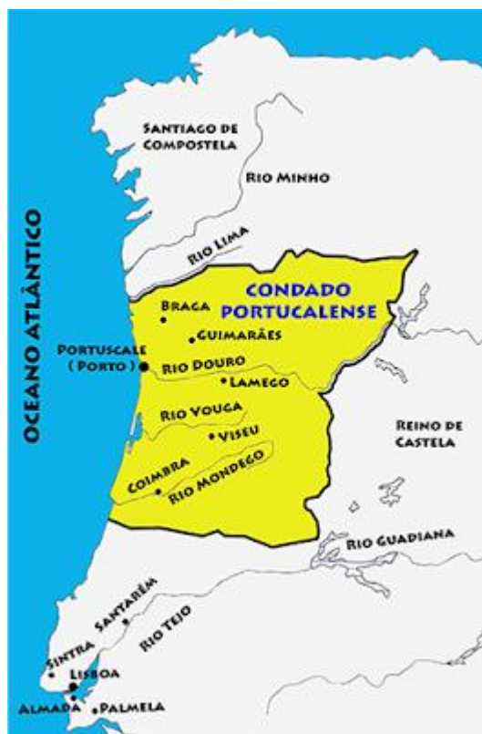
Obrázek č. 3 Portugalské hrabství

zvanou hrabství Portugalska. Alfonso VI. udělil tuto část Jindřichovi Burgundskému jako dědičné léno i doživotní guvernérství. Sloučení Portugale a Coimbrly do jediného hrabství bylo zásadním krokem, protože zde bylo jádro budoucího portugalského království. 78