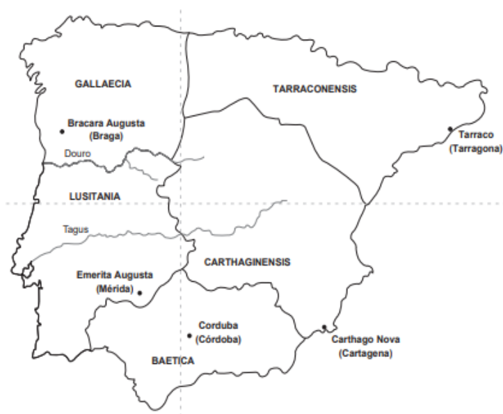
Obrázek č. 2 Jednotlivé provincie a jejich hlavní města v římském období