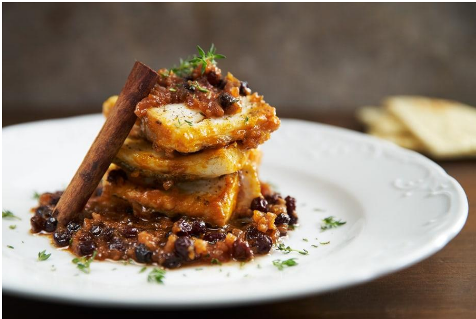
Obrázek č. 10 Bacallau ao Forno noc Pasas