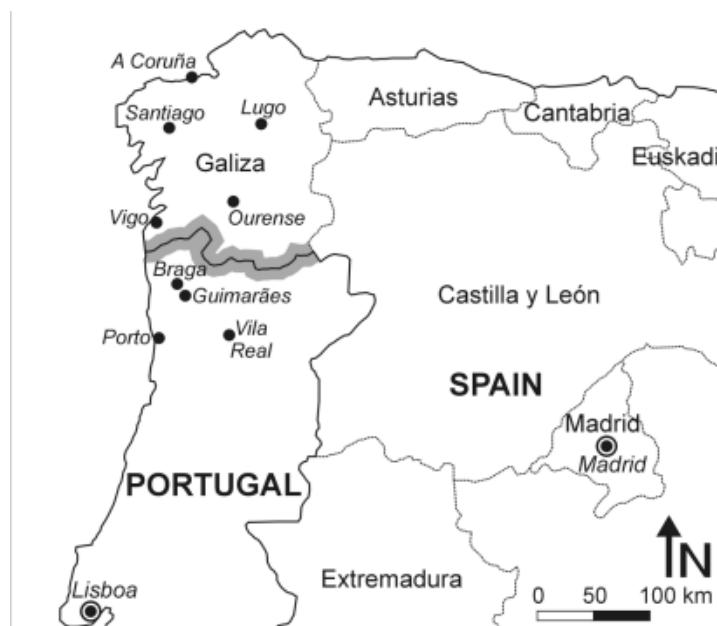
Obrázek č. 5 Hranice mezi Portugalskem a Galicií

Hranice jsou primárním místem pro definování a redefinici národů a států a stojí za to podrobně prozkoumat sociální realitu těch, kteří na nich skutečně žijí. Hranice jsou důležitým místem pro pochopení států a národů – myšlenek, abstrakcí, „imaginárních společenství“ a administrativních pravomocí, které mají velmi reálné důsledky pro ty, kteří na hranicích žijí. 114 Hranice by se neměla brát jen jako pomyslná čára, ale jako konkrétní zóna, oblast, místo nebo region, které jsou ovlivněny mezinárodní hranicí. Tyto pohraniční regiony jsou specifickými územími, ve kterých mají sociálně-prostorové vztahy zvláštní rysy. Portugalsko-galicijská hranice známá jako „raia“ je přibližně 300 km dlouhá a existuje přibližně od 12. století. Obecně je hranice mezi Portugalskem a Španělskem brána jako jedna z nejstarších. Raia není pouze hranicí mezi dvěma zeměmi, ale také specifickým územím, které se rozprostírá na pomyslné mezinárodní linii. 115