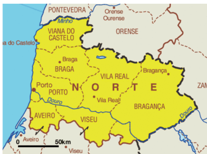
Obrázek č. 1 Navštívená oblast během výzkumu

Jako téma výzkumu byla vybrána menšina Galicijců, kteří žijí na severu Portugalska. Dalším krokem bylo stanovit metodologii, díky které budou získány potřebné informace. Nejdříve bylo zapotřebí nastudovat sekundární literaturu, aby výzkumníci získali povědomí o daném tématu, a až poté se realizoval výzkum. Vzhledem k výběru tématu a zvolené etnické menšině se místem výzkumu stal region Norte (sever Portugalska) a to z důvodu, že tato oblast má společnou „portugalsko-španělskou“ historii a také proto, že tento region přímo hraničí s Galicií. V současné době žije v této oblasti přibližně 15 000 Galicijců 31 , avšak najít oficiální statistické údaje o konkrétních počtech se jeví poměrně složitě, protože většina Galicijců se již asimilovala mezi Portugalce, a tak nikde neudávají, že jsou Galicijci. Případně se jako Galicijci cítí, ale není to uvedené ve statistikách. První návštěva této oblasti proběhla v červnu roku 2021, v srpnu téhož roku se výzkumníkům podařilo do těchto míst znovu navrátit.