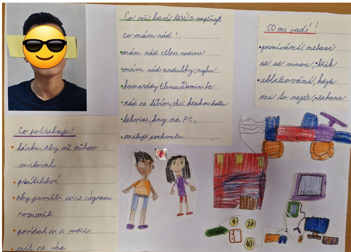
Obrázek 2: Jak se vidím (vlastní obrázek)