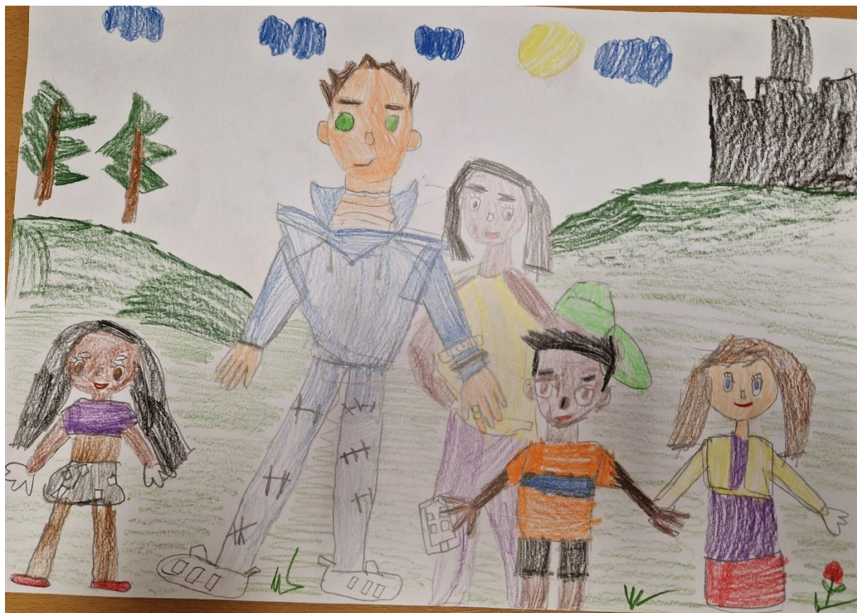
Obrázek 1: Rodina (vlastní obrázek)

Pro dokreslení osobnosti žáka přikládám ukázky jeho práce.