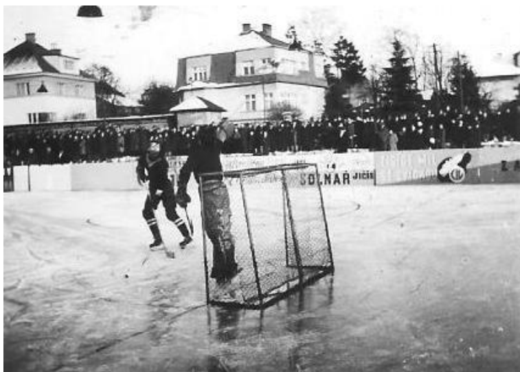
Obrázek 9 Zápás proti Sokol Žel. Brod - postup do divize