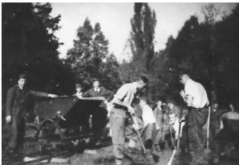
Obrázek 10 Výstavba nového kluziště