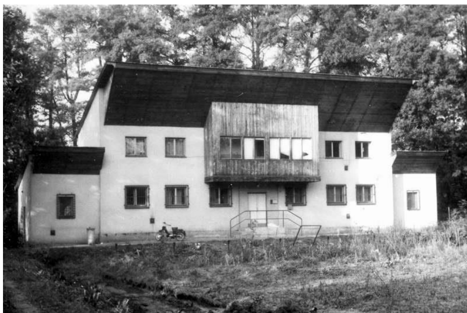
Obrázek 18 Pozůstatky zimního stadionu v roce 1986