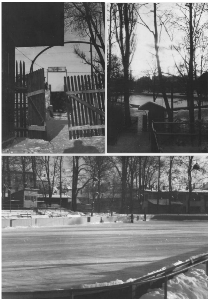
Obrázek 13 Výsledná podoba kluziště na konci roku 1953