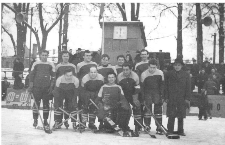
Obrázek 12 Sestava Závodního družstva Jičín 1952-1953