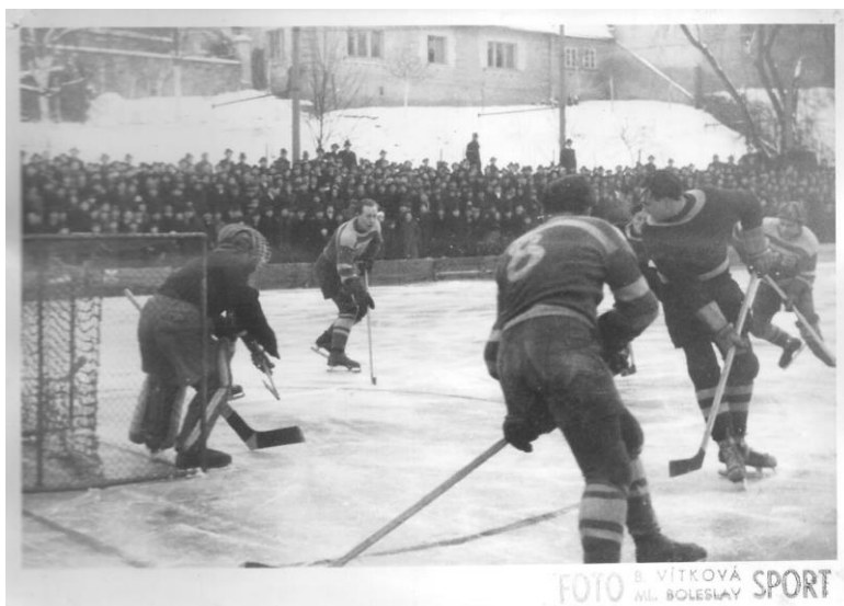
Obrázek 7 Zápás proti BK Mladá Boleslav