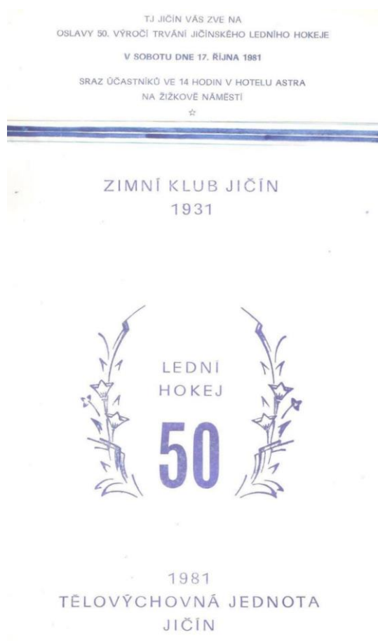
Obrázek 17 Pozvánka k výročí 50 let hokeje v Jičíně