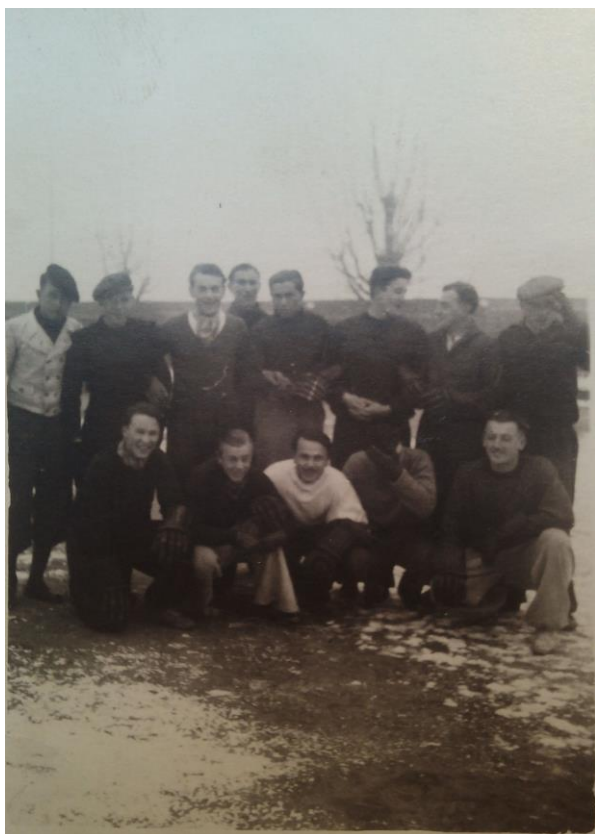
Obrázek 5 Nábor mládeže