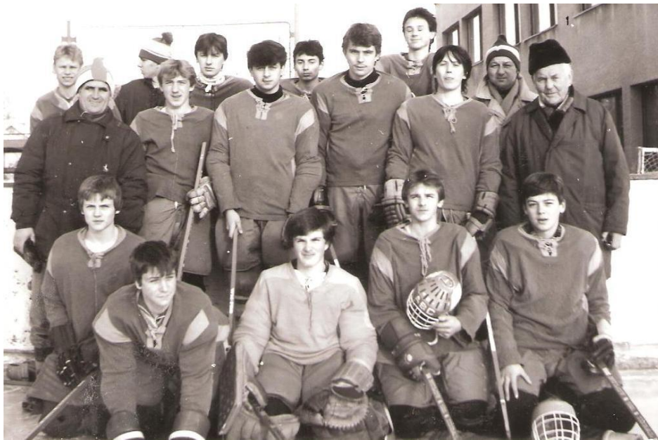
Obrázek 20 Vítězné družstvo dorostu v roce 1987