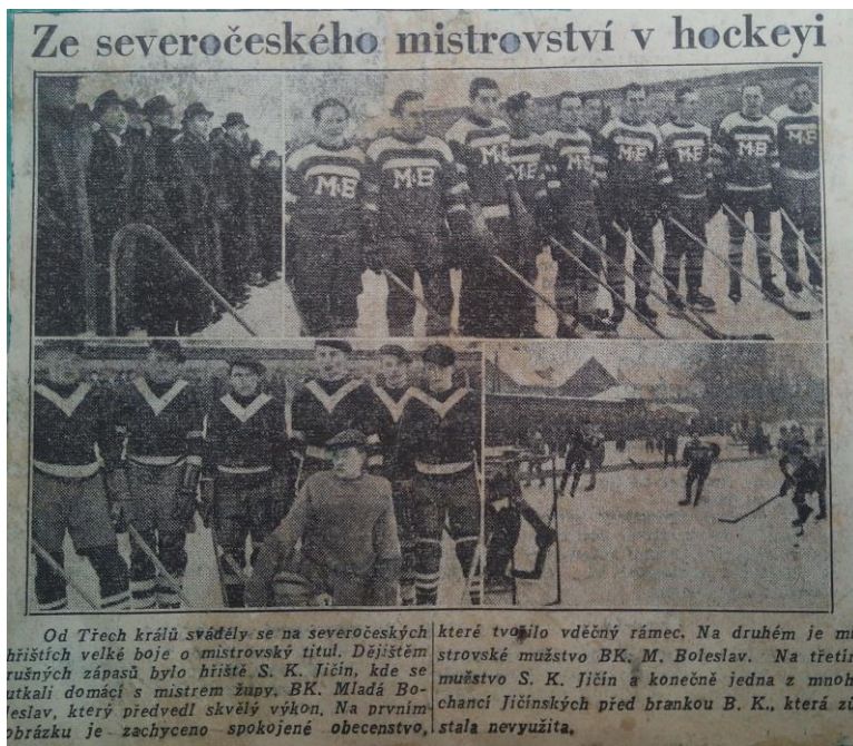
Obrázek 3 Extratřída čtyř mužstev na jičínském Knížeti