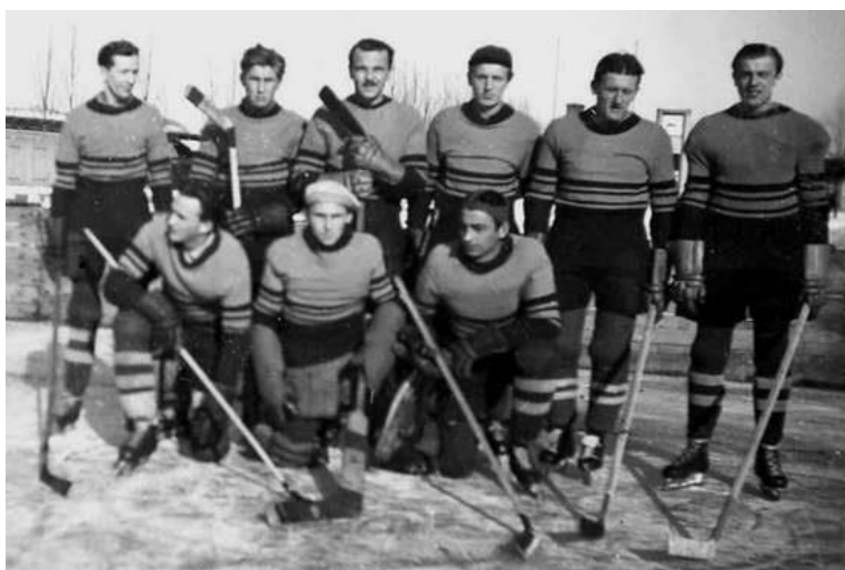
Obrázek 8 Sestava SK Jičín při postupu do divize 1944