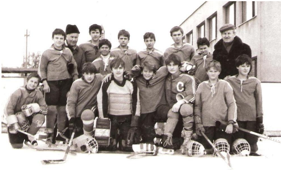
Obrázek 19 Vítězné družstvo žáků v roce 1987