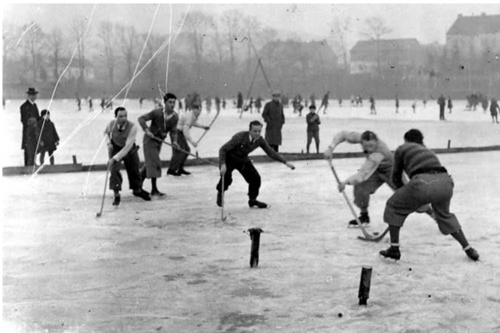
Obrázek 1 Počátky hokeje na kluzišti Kníže