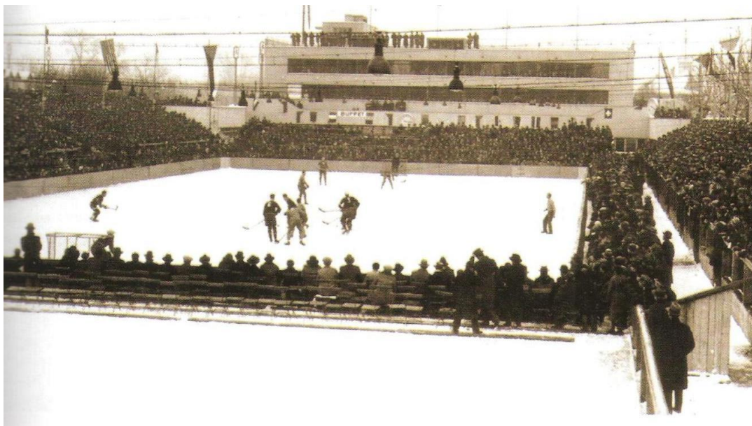
Obrázek 14 První umělá ledová plocha na Štvanici