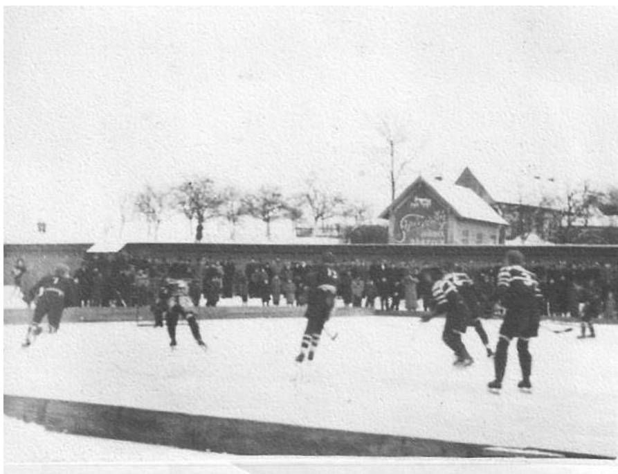
Obrázek 6 Návštěvnost