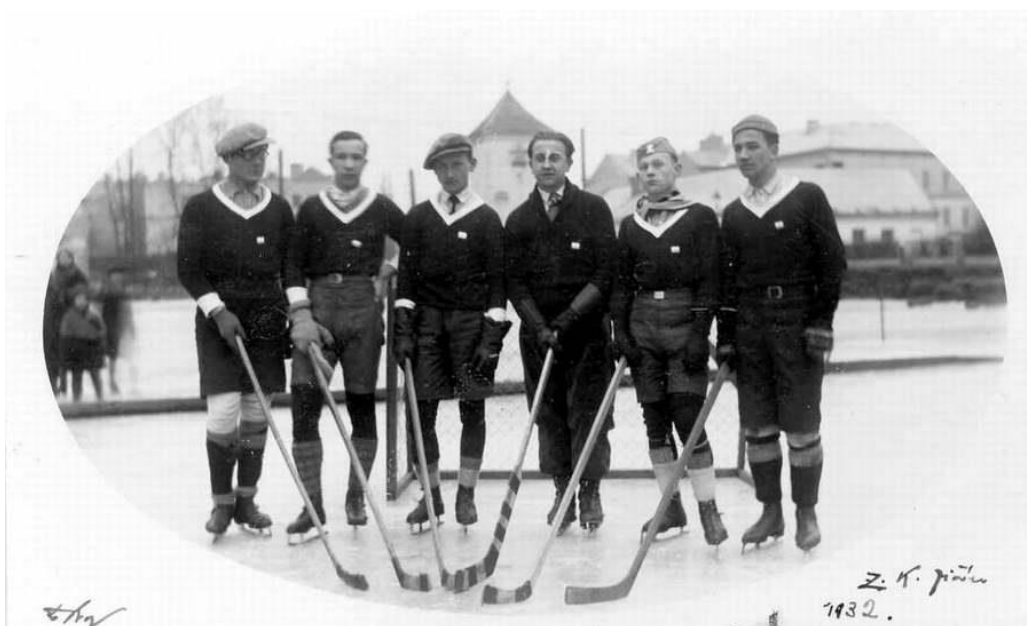
Obrázek 2 Sestava ZK Jičín v roce 1932