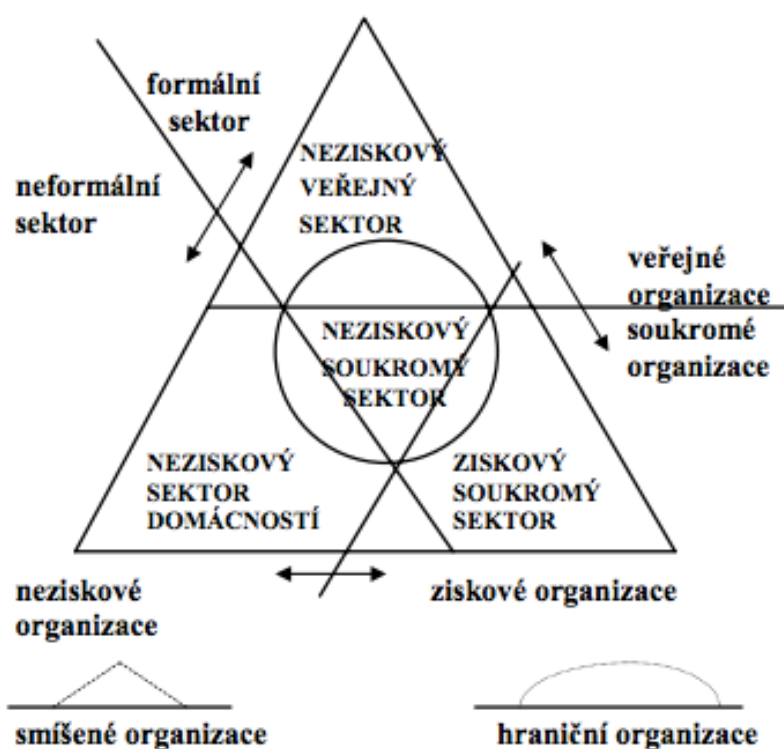
Obr. 2 Členění národního hospodářství podle Pestoffa

Zdroj: REKTOŘÍK, Jaroslav. Organizace neziskového sektoru: základy ekonomiky, teorie a řízení . 3., aktualiz. vyd. Praha: Ekopress, 2010