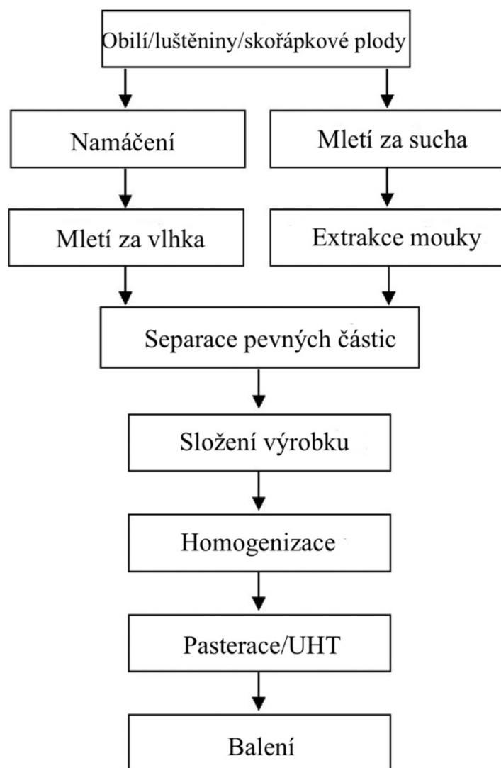
Obrázek 3 Schéma výroby rostlinných nápojů, přeloženo z Reyes-Jurado et al. (2023)

Rostlinné alternativy mléka jsou koloidním systémem tvořeným vodou, danou surovinou a následnou fortifikací minerálními látkami či vitaminy (Bocker & Silva 2022). V následujících kapitolách budou podrobněji rozebrány kroky výroby rostlinných nápojů, které jsou znázorněny na Obrázku 3.